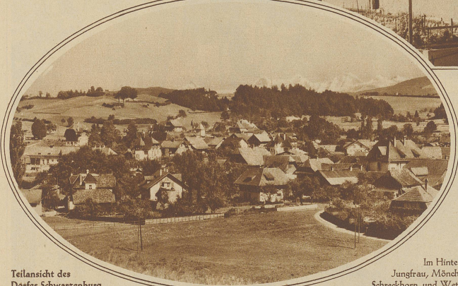
Teilansicht des Dorfes Schwarzenburg