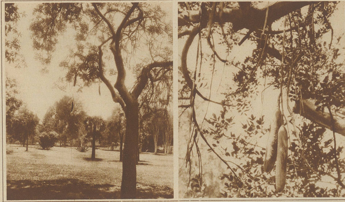
Vegetarische Würste. In den zentralafrikanischen Gebieten von Senegal und Mozambique wächst ein eigenartiger Baum («Kigelia pineta» heißt sein wissenschaftl. Name), dessen Früchte große Ähnlichkeit mit Würsten haben, die von den Eingeborenen auch gegessen werden. Der prächtigen roten Blüten wegen, die den Baum zur Blütenzeit traubenartig bedecken, hat man versucht, ihn auch als Zierbaum nach Europa zu verpflanzen, leider bisher ohne Erfolg.

Zitternden Herzens las sie ihm die Worte