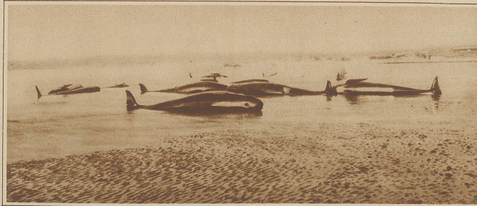
Gesträndete Piloten-Walfische, oder Schwarzfische

Kleins, leb' wohl! Unsere Wege trennen sich jetzt, wahrscheinlich für immer! Der meine führt wieder dem Genuß und der Freude entgegen. Wie schade ist es doch, daß Du, gerade Du, in die Hände dieses Rüpels fallen mußtest!