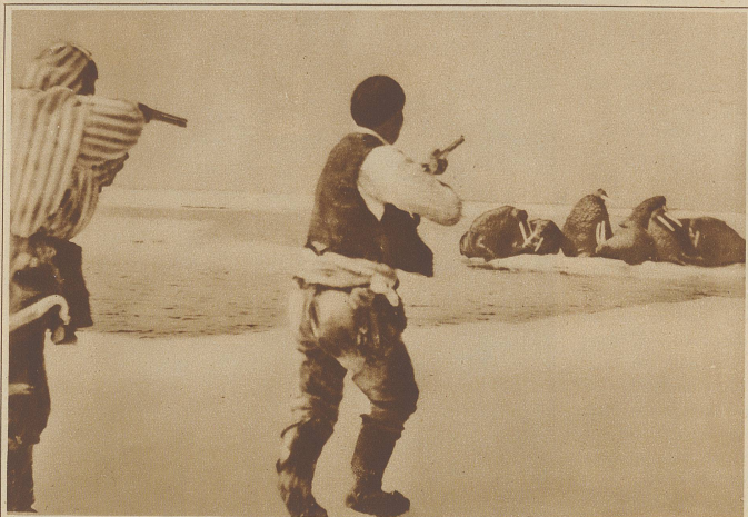
Eskimos auf der Walrobjagd