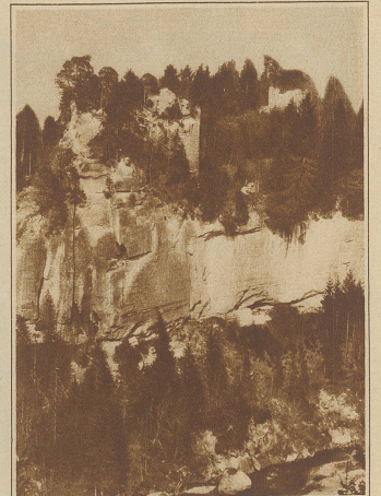
Die Ruine Crasburg auf einem hohen Felsvorsprung an der Sense. Die Crasburg wurde in der zweiten Hälfte des 12. Jahrhunderts auf den Ruinen eines römischen Kastells aufgebaut und durch die Zähringer mit den Ritters von Crasburg besetzt, die 1310 ausstarben. 1423 ging sie durch Kauf an die Städte Freiburg und Bern über und wurde Sitz der Landvögte

«Warum sagst Du mir Worte, die ich nie gehört habe? Mein Heim? Ich kenne es noch