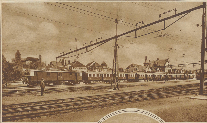
Die neuen Vorentzüge der Schweiz Bundesbahnen, die versuchsweise vorerst auf den Strecken Basel-Olten und Zürich-Rapperswil verkehren werden. Der Zug besteht aus je einem Motorwagen und einem Zugführungswagen, sowie aus drei Doppelwagen, die kurz gekuppelt und durch Faltenbalds und bequemem Übergang verbunden sind. Jedes Rangieren des Motorwagens fällt weg, da der Motorwagen auch von dem an anderen Ende sich befindenden Führerwagen aus gesteuert werden kann, so daß also nur der Führer die Kabine zu wechseln hat. Alle Türen werden vom Führerstand aus automatisch auf einen Schlag geschlossen, sobald sich der Zug in Bewegung gesetzt hat. — Das Rollmaterial des ganzen Zuges wurde von der Schweiz Waggonfabrik Schlieren, die elektr. Ausrüstung von Scheren in Gené geliefert.