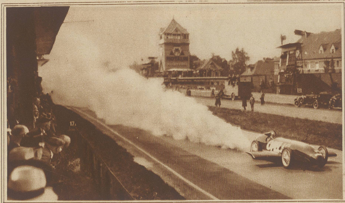
Die riesige Rauchfahne wird durch die Explosionen der Raketen verursacht. Die seitlichen, abwärts gerichteten Ausleger in Form von Flugzeugtragflächen sollen den Wagen zu Boden drücken.

das ganze Reich der Mitte sehen, das unermessliche?