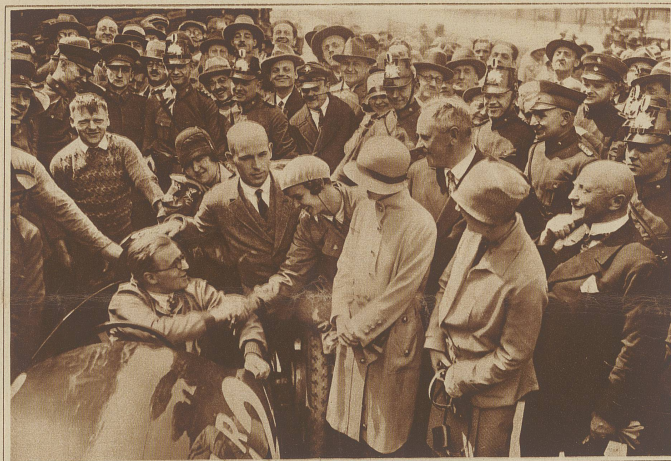
Fritz von Opel, der Führer des Wagens; hinter ihm, auf dem Rad sitzend, der Erfinder Valier

Einen ganz andern Weg als Goddard, Oberth und Hoefft will der aus Südtirol stammende Münchner Flieger und Astronom Max Valier