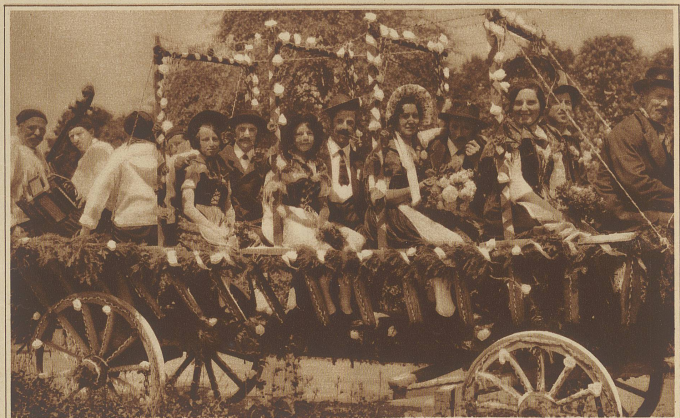
Bauernhochzeit zu Großvaters Zeiten. Aus dem Festzug anläßlich des Schwyzer kantonalen Schwyz- und Aepferfestes in Stöben

Es ist Gift, ein schweres Gift. Dieser Komponist ist der Todfeind der wahren Musik. Der Mann ist nicht imstande, eine Note zu schreiben. Eine wirklich verrückte Musik. Paroxysmen musikalischer Nervosität. Delirium tremens in Musik umgesetzt. Eine Epidemie von Harmonieirrsinn.