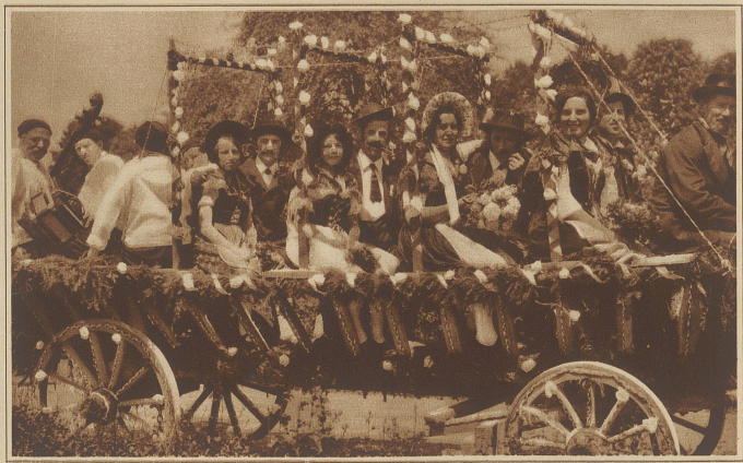
Bauernhochzeit zu Großvaters Zeiten. Aus dem Festzug anlässlich des Schwyzer kantonalen Schwyz- und Aepferfestes in Stöben

Es ist Gift, ein schweres Gift. Dieser Komponist ist der Todfeind der wahren Musik. Der Mann ist nicht imstande, eine Note zu schreiben. Eine wirklich verrückte Musik. Paroxysmen musikalischer Nervosität. Delirium tremens in Musik umgesetzt. Eine Epidemie von Harmonieirrsinn.