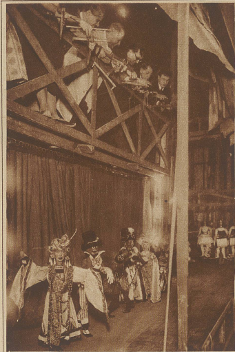
Blick hinter die Kulissen des Marionettentheaters