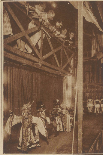
Blick hinter die Kulissen des Marionettentheaters