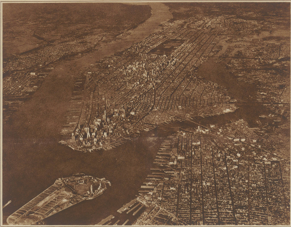
NEW YORK aus der Vogelschau.

Zehn Minuten lang war kein Laut zu hören, das leise Ticken einer Uhr und das Fallen der Asche im Kamin ausgenommen. Dann hörte er etwas, was ihn elektrisierte. Leise Schritte auf dem Balkon draußen waren deutlich zu hören. Er überlegte, ob es ein Diener wäre, und ob er merken würde, daß einer der Läden nicht zugemacht war. Fast wäre er aufgestanden, um nachzusehen, wer draußen ging, aber dann erklangen Geräusche vom Korridor her — ein schwerer Tritt, und die Tür ging auf, Lichter wurden angezündet, und der Mann hinter dem Sofa drückte sich platt auf den Fußboden und hielt den Atem an.