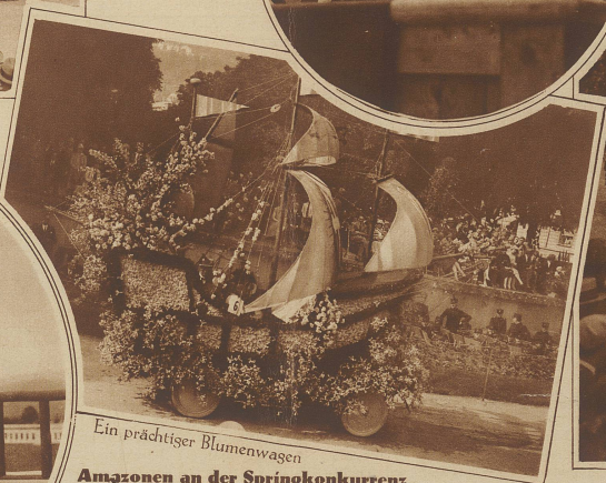
Ein prächtiger Blumenwagen