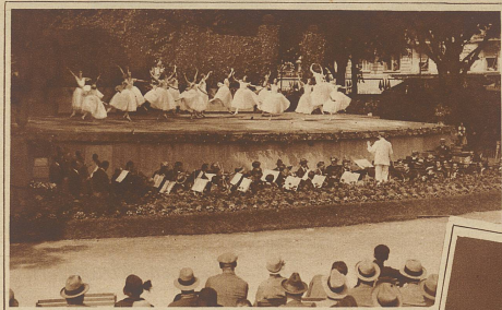
Nocturno aus dem Ballett «Les Sylphides»