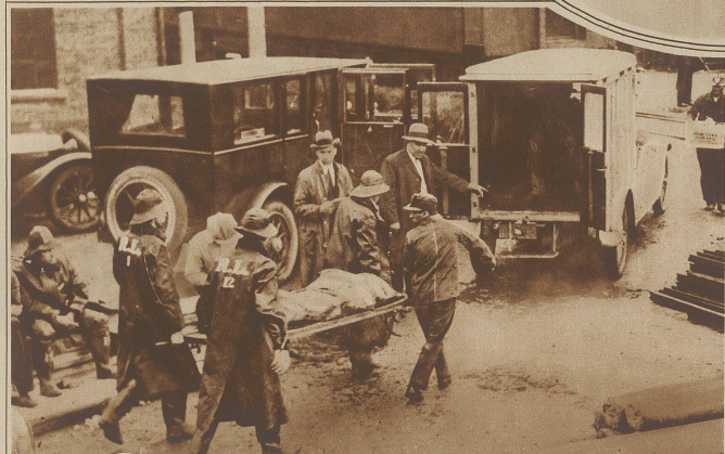
Eine schwere Explosionskatastrophe hat sich in der amerikanischen Kohlengrube Mather, Pa. ereignet, wo durch ein schlagendes Wetter 150 Mann eingeschlossen wurden. Die Rettungsarbeiten gestalteten sich infolge des entstandenen Grubenbrandes äußerst schwierig. Die Zahl der Toten wird auf 64 angegeben.