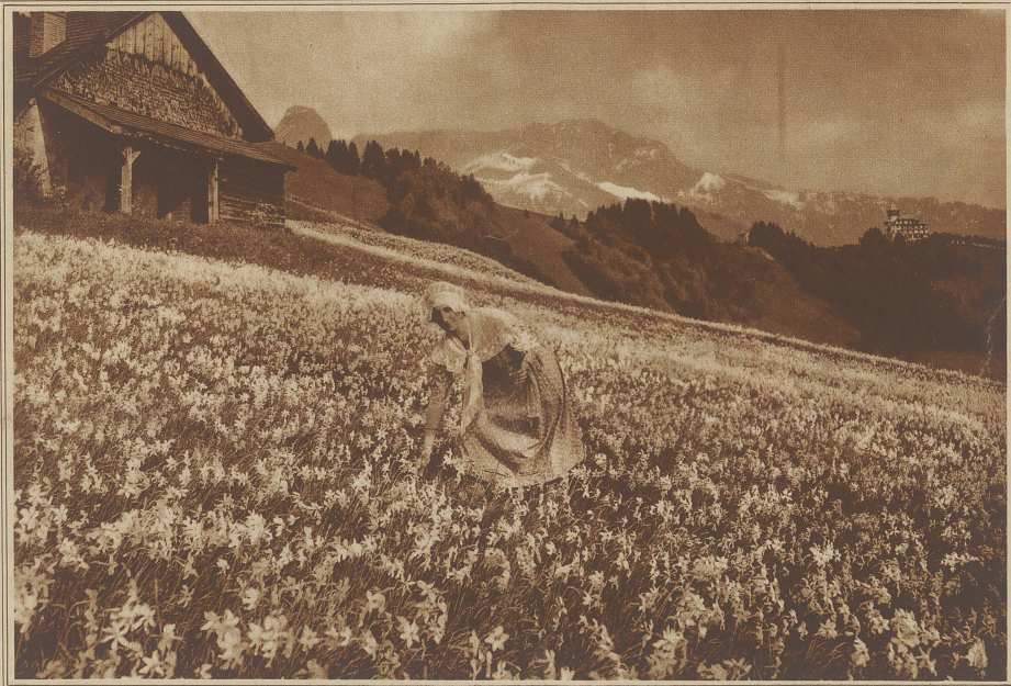
Blühendes Narzissenfeld bei Les Avants

Der Oberst lachte höhnisch. «Würde er auch keinen Mord begehen? Würde er Sie nicht auch erschießen? Natürlich ist es Treffbube, der Richter, gewesen. Ich sage Ihnen, in jener Nacht, als Sie in Yorkshire das Crofting-Geschäft verpflanzten, besuchte mich Treffbube