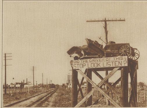
Ein eigenartiges Warnungszeichen für unvorsichtige Automobilisten an einem Bahnübergang bei San Antonio in Texas

Links: Empfang bei der Rückkehr der Ozeanflieger Köhl, Fitzmaurice und Hähnfeld, denen die erste Ost-West-Transversierung gelang, in den Straßen von Bremen