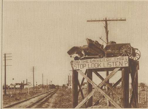
Ein eigenartiges Warnungszeichen für unvorsichtige Automobilisten an einem Bahnübergang bei San Antonio in Texas

Links: Empfang bei der Rückkehr der Ozeanflieger Köhl, Fitzmaurice und Hühnefeld, denen die erste Ost-West-Transversierung gelang, in den Straßen von Bremen