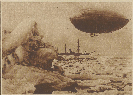
Das italienische Hilfschiff «Braganza» im Packeis bei Spitzbergen. Man kann sich leicht vorstellen, daß die Rettungsaktionen in dieser Eiswüste auf gewaltige Schwierigkeiten stoßen