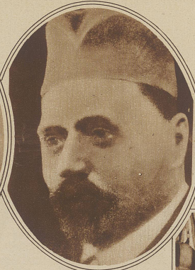
Eine Bluttat in der Skupschtina. Im jugoslawischen Parlament in Belgrad feuerte der Abgeordnete Ratschitsch mit einem Revolver blindlings gegen die Reihen der Opposition. Die beiden der kroatischen Bauernpartei angehörenden Abgeordneten Paul Raditsch und Djura Bassaritsch wurden getötet, während 4 andere Abgeordnete, darunter der bekannte Bauernführer Stelan Raditsch (Porträt), schwer verletzt wurden

Rechts: Mitten über der Stadt Kopenhagen stürzte letzte Woche ein von zwei Piloten besetztes Flugzeug ab. Die Piloten wurden getötet und die Trümmer verletzten außerdem einige auf der Straße spielende Kinder