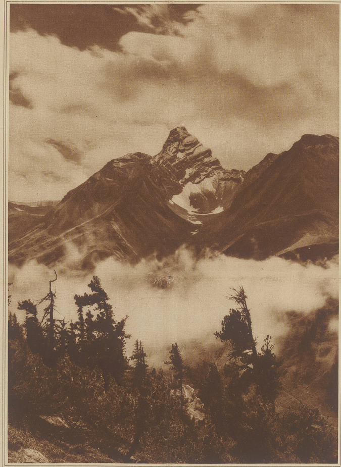
Nebelreiben am Tinsenhorn

Er schrieb ihre Aufregung den von ihr gar nicht beachteten Unheilszeichen zu: Flammen tanzten auf dem milchigen Meer, brennbare Gase, ent- zündet von glühenden Steinen, die in breiter Feuergarbe von Nea Kaymeni aufstiegen, als leuchtender Regen auf die dunkle Lava nieder- prasselten, um hier in Millionen Funken zu zer- stieben. Wenn der Rauch nachließ, sah man