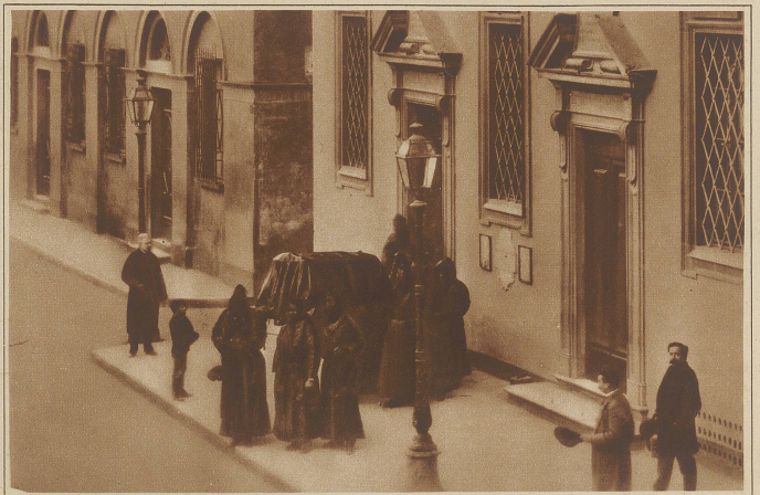
Mitglieder der Misericordia tragen einen Mann zur letzten Ruhe

Von dem Auflösungsdekret, das Mussolini gegen alle Logen erlassen hat, ist nur eine nicht betroffen worden: die «Confraternità di Santa Maria della Misericordia», oder im Volksmunde kurz «Misericordia» genannt. Sie verdankt ihre Ausnahmestellung der Tatsache, daß sie nur Gutes tut und allen Menschen, ob arm oder reich, ihre Hilfe angedeihen läßt. Dieser Loge gehören hauptsächlich Intellektuelle und Künstler an, die sich durch einen schwarzen Mantel und eine Kappe unkenntlich machen. Die Pflege Schwerkranker, die Besorgung von Krankentransporten und Beerdigungen sind die hauptsächlichsten Dienstpflichten, die den Mitgliedern auferlegt werden.