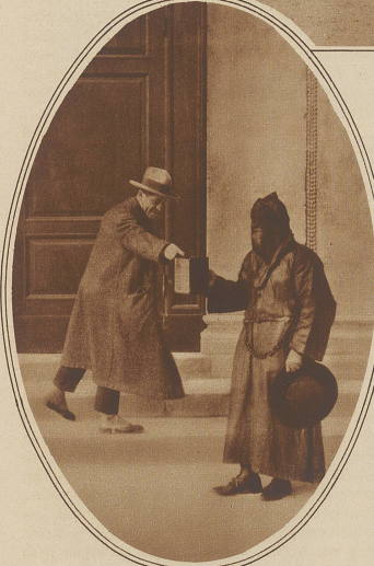
Ein verummtes Mitglied der Loge sammelt Spenden für die Armen

Steilabfalle von Santorin außer dem Fallbereich der Steinbomben.