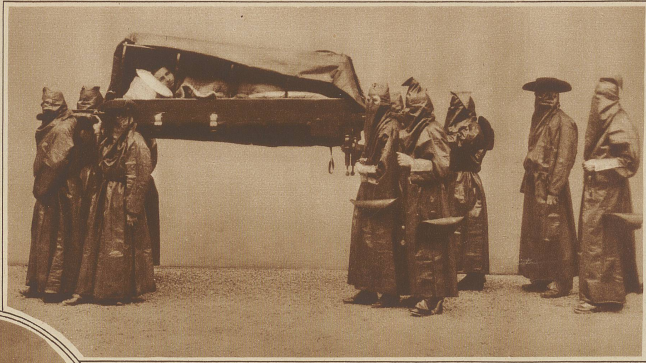
Ein Krankentransport der Misericordia

eine schwarze Klippe aus dem Meer emporsteigen. Ein schauerliches Getöse kam aus den Eingewänden der Erde. Der Steuermann sandte seinen gewandtesten Matrosen, einen Levantiner, ans Land, die Mannschaft heimzuholen, den Herrn zu suchen, die Schiffspapiere zu besorgen. Als die Besatzung nahezu beisammen war, lichtetete er die Anker, die der rasenden See nicht mehr standgehalten hätten, und kreuzte nahe dem