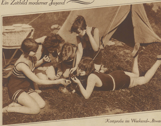
Kostprobe im Weekend-Biwak

forschungen, die er in 50 Volksschulen anstellte, 40 Prozent aller SchülerInnen keine Bibel befuhr er, daß 50 Prozent aller Schüler und