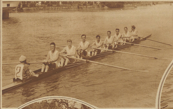
Der Meisterschaftsachter des Ruder-Club «Reuß», Luzern