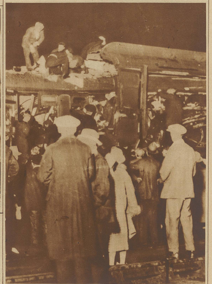
Bild rechts: Ärzte machen den in den Trümmern eingeklemmten Reisenden Morphium-Einspritzungen, um ihnen die Schmerzen zu lindern, bis sie aus der schrecklichen Lage befreit werden können