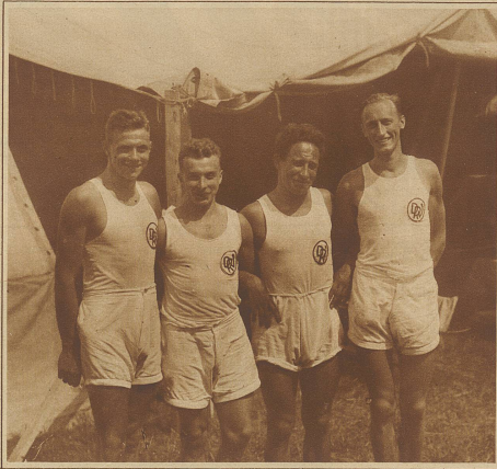
Die Mannschaft des Deutschen Rudervereins Zürich gewann die Meisterschaft im Vierer o. St.