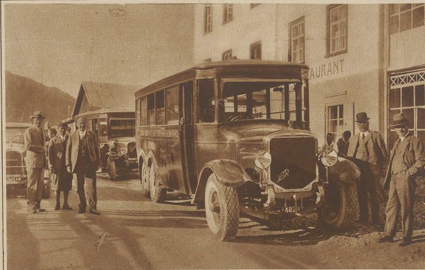
Die neuen Auto-cars, die nun den Verkehr zwischen Davos-Dorf und «Platz» vermitteln