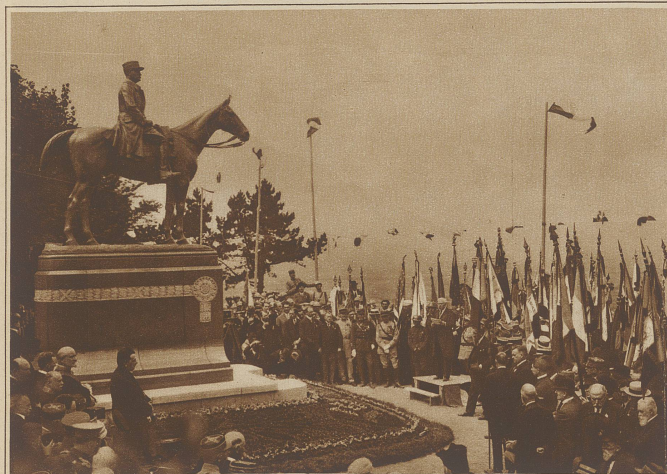
In Cassel (Nordfrankreich) wurde am Sonntag das Denkmal für Marschall Foch eingeweiht. Foch wohnte der Feier persönlich bei. Im Bilde verliert Ministerpräsident Poincaré seine Enthüllungsansprache