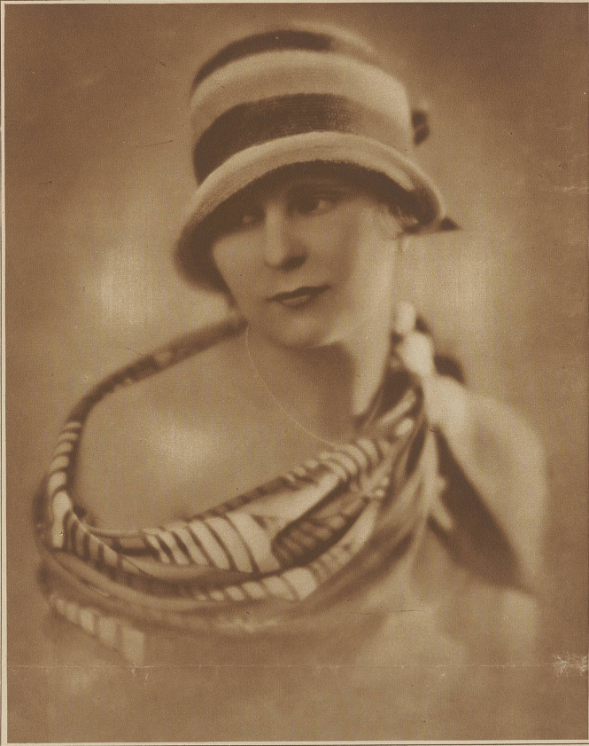
Halbgroßer Hut aus dreifarbig schattiertem Tedda

Mary Pickford bewohnt mit ihrem Gatten Douglas Fairbanks die zweite dieser Luxusgarderoben. Ihre Räume, in dem schlichten englischen Kolonialstil eingerichtet, sind erfüllt mit Blumen, Sonnenschein und Vogelgesang. Das Ankleidezimmer ist in Hellrosa und Blau gehalten. Die Küche ist sehr geräumig, denn hier waltet ein besonderer Küchenchef seines Amtes, um für das Paar zu kochen. An den Wänden hängen Photographien berühmter Persönlichkeiten, die eigenhändig «Amerikas Liebling» von ihnen gewidmet wurden. Man liest da die Inschrift der Duse, Mussolinis, d'Annunzios, Marconis, Edisons und andere. «Doug» hat seine Garderobe in Schwarz und Gold in chinesischem Stil eingerichtet. Besonders gern weilt er in dem prächtigen Baderaum, der auch ein Dampfbad enthält. Sein Papagei «Rosita» trägt sich gut mit seinem mächtigen Bernhardiner «Robin Hood», von dem er unzertrennlich ist. Die dritte Garderobe gehört John Barrymore , der die Räumlichkeiten mit Corrinne Griffith teilt. Barrymores Räume atmen die Ruhe einer hohen Kultur und reichen Bildung. Da sieht man Altflorentiner Möbel und goldene Engel, die von einem Florentiner Altar