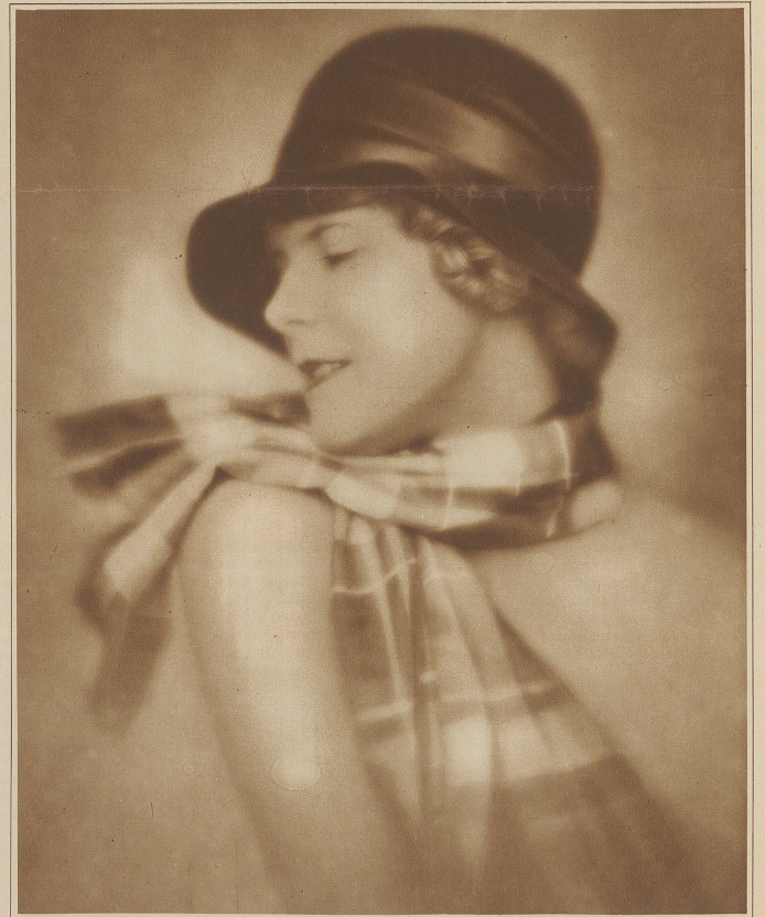
Der moderne Shawl

wieder auszuwetzen: sie beauftragte ihn, der deutschen Gesandtschaft wichtige Geheimdepeschen zu entwerfen. Wie glänzend er diese Aufgabe gelöst hat, steht noch in unser aller Gedächtnis. . .