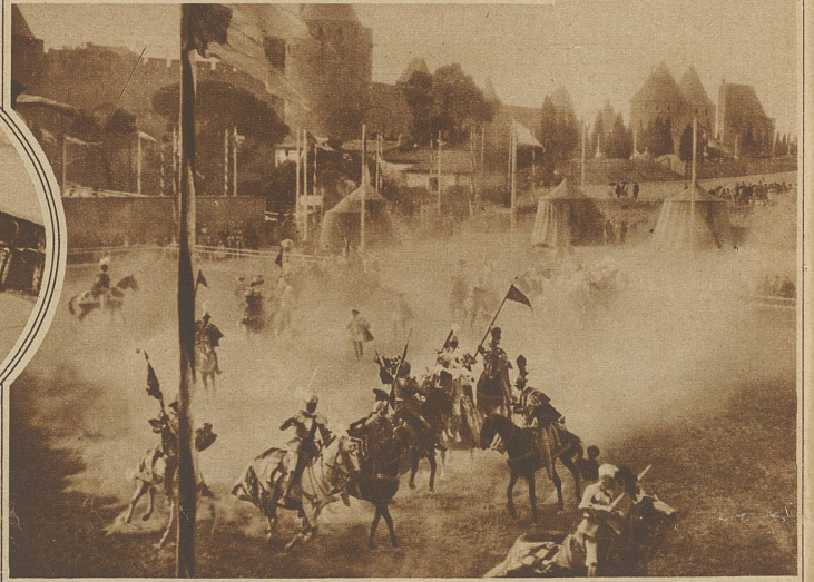
Eine Szene aus den mittelalterlichen Reiterspielen, die anlässlich der Jahrtausendfeier durchgeführt wurden