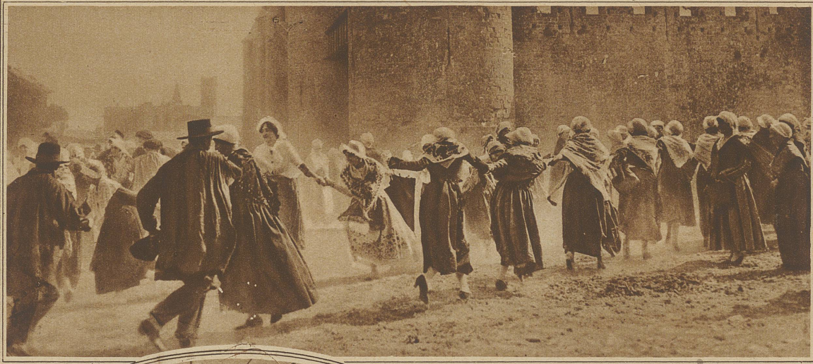
Bild links: Alte Tänze in typischen Kostümen vor den Fe- stungsmauern von Car- cassonne