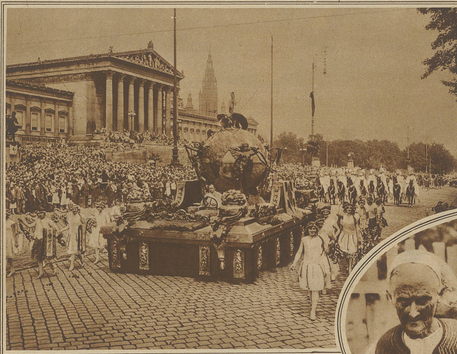
Am Sanger-Bundesfest in Wien, das Anlaß zu einer machtigen Kundgebung fur den Anschlu Oesterreichs an Deutschland bot, nahmen etwa 200000 Sanger teil. Unsere Aufnahme zeigt den Bundesfestwagen, das weltumspannende «Deutsche Lied» darstellend

Die in Sudfrankreich gelegene Stadt Carcas- sonne, deren gewaltige mittelalterliche Festungs- werke jedem Besucher unvergeliche Eindrucke vermitteln, beging mit groen Festlichkeiten die Feier ihres 2000jahrigen Bestehens. Das auf einem Hugel gelegene Kastell mit seinen 40 Turmen ist heute beinahe unbewohnt