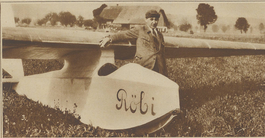
Nach dem Start auf dem Niesen = kulum