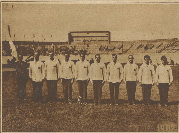
Die Turner der Tschechoslowakei, die als einzige dem Resultat der Schweizer nahekamen. Sie totalisierten 1712,25 Punkte