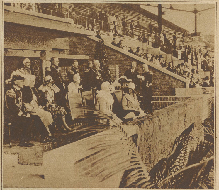
Königin Wilhelmine zu Besuch bei den Olympischen Turnwettkämpfen