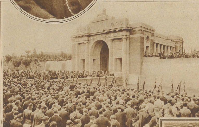
Links: Die religiöse Feier vor dem Denkmal Menin Gate in Ypern Gedächtnisfeier für die Gefallenen von Ypern. Unter Führung des Prinzen von Wales pilgerten letzte Woche 11000 englische Kriegsteilnehmer, begleitet von Witwen und Kindern gefallener Soldaten, zur Erinnerungsfeier beim Soldatendenkmal in Ypern