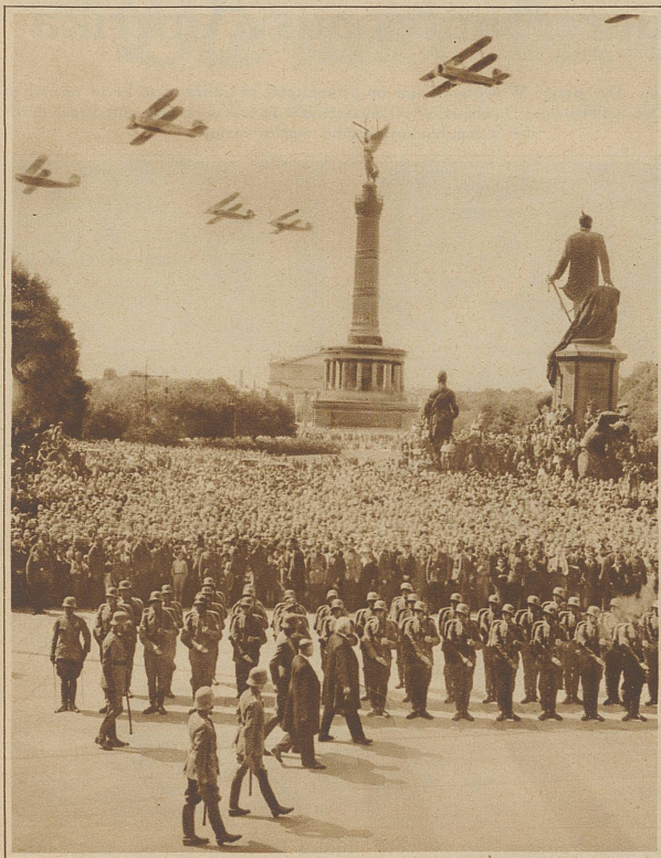
Deutsche Verfassungsfeier am 11. August in Berlin. Reichspräsident Hindenburg schreitet die Front ab