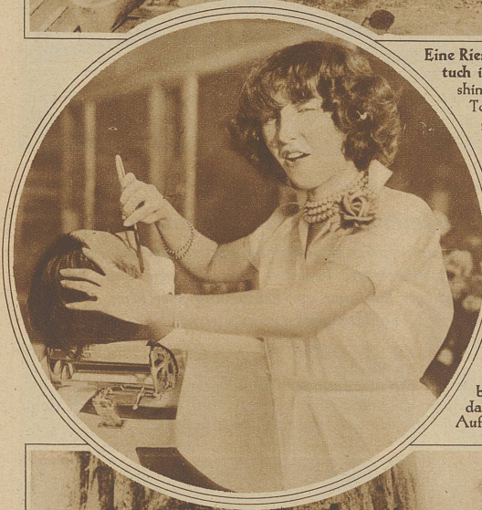
Ein New Yorker Coiffeur hat eine neue Attraktion eingeführt. Er läßt die männlichen Kunden von zarter Damenhand rasieren. Das Geschäft soll seit der Einführung dieser Neuerung, die übrigens auch in der Schweiz schon versucht wurde, - irgendwo in Baselbiet rasierte nämlich während der Grenzbesetzung eine Dame die Soldaten - einen bedeutenden Aufschwung genommen haben