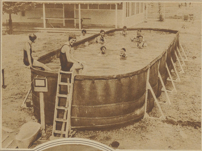
Eine Riesenbadewanne aus Segeltuch im Potomac Park in Washington. Den Besuchern dieses Touristen-Camps wird mangels eines Sees auf diese Weise Schwimmgelegenheit geboten