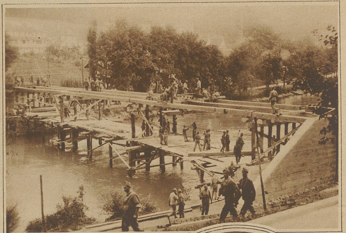
Stand der Bauarbeiten am 4. Tage