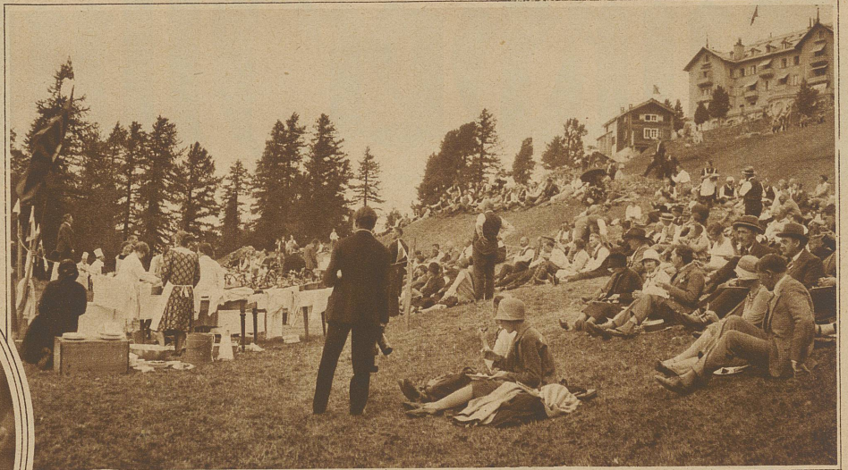
Das originelle, von den Hotels Seiler offe- rierte Picknick auf Riffelalp