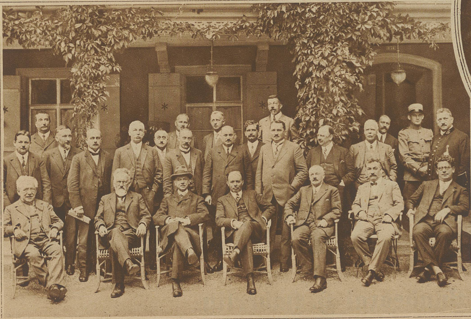
Die nationalrätliche Getreidekommission, die im Beisein von Bundesrat Musy (Mitte sitzend) in Heiden taste