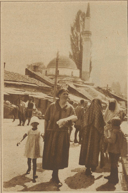
Der Marktplatz in Serajevo

plomben umgegangen. Es kostet paar Dinare «Sporteln» und los werden wir gelassen auf die schnurgerade Landstraße. Nichts wie Weizen- und Kukuruz (Mais)felder. Kein Mensch ist zu sehen. Dörfer scheinen ausgestorben zu sein. Gänseherden empfangen uns laut protestierend, ziehen sich schließlich vor den drohenden Gummirädern auf das Straßenbord zurück, uns mit vorgestrecktem Hals deutlich ihre Antipathie zeigend. Von den Feldern winkt man uns zu. Gewaltige Staubwolken lassen wir zurück, Staubwolken, die uns in der Schweiz schon längst die Fahrbewilligung gekostet hätten.