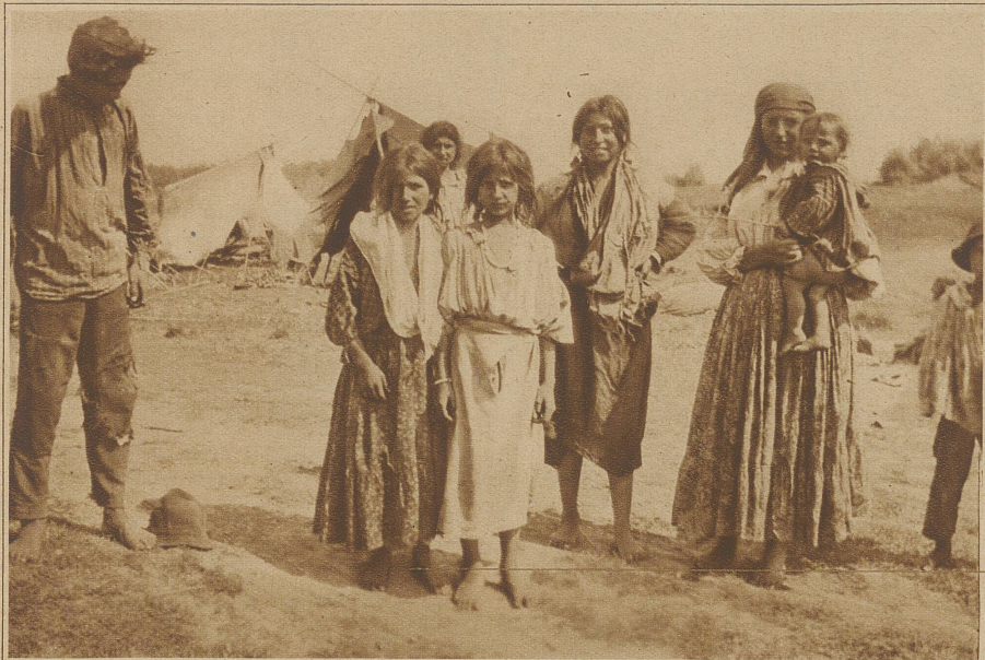
Vor einem Zigeunerlager bei Gradiska

Wasserfall gleich. Er merkt, daß wir nichts verstehen, lakonisch folgt: Via bona, dann Via optima. Immerhin beruhigend. Hoffentlich liest mein Lateinlehrer, Herr Prof. Hirsch, diese Zeilen nicht. Bei der nächsten Lateinstunde bekämen seine jetzigen lateinfaulen Schüler bestimmt zu hören: «Sehen Sie, wie wichtig das Lateinisch — wie's da einem meiner früheren Schüler gegangen — ohne Latein wäre der nie nach Bihac gekommen!»