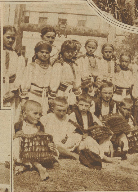
Links: Schulkinder aus Draganci. Man beachte die eigenartigen Schultaschen der Knaben

zum Nachtmahl sind ausgezeichnet — vielleicht stimmt schon etwas mit diesem «besten Wein». — Kalkgebiet, für den Autofahrer gleichbedeutend mit schlechten Straßen. Es geht noch, nur die Staubwolken sind verheerend. Kahle Karsthochebenen wechseln mit engen tiefeingeschnittenen Tälern, eher Schluchten. In keinem Verhältnis zu ihrer Größe und Wildheit stehen die kleinen, smaragdgrünen Flüssen. Die bosnische Grenze ist nicht mehr weit. Burgruinen lassen frühere, erbitterte Kämpfe gegen die Türken ahnen. Groß ist der Gegensatz zu den reichen Talbewohnern. Die Bergbauern wohnen in ärmlichen Hütten, ebenerdig, einstöckig und mit Stroh oder Schindeln bedeckt. Aber selbst das kleinste Häuschen ist sauber getüncht, entweder blendend weiß oder bläulich. Die Bewohner gehen in sauberer Leinentracht. Groß ist die Wassernot. Stundenweit tragen die Frauen die zu waschende Wäsche auf dem Kopf bis zur nächsten Wasserstelle und kilometerweit muß das Trinkwasser hergeführt werden. An Stelle der Wagen sind die Bergpferdchen getreten. Diese geduldigen Tiere sind mit allen Landesprodukten beladen: Getreide, Brennholz, Schafwolle, Faschinenruten (zur Herstellung von Zäunen), Lebensmittel, Wasser usw.