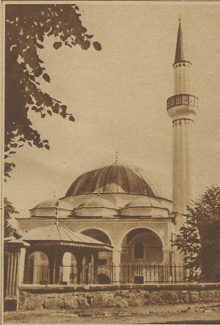
Moschee bei Merkory-Grad

züglich, Steigungen für anspruchslosere Herrenfahrer genügend. Bis 26% (sprich: