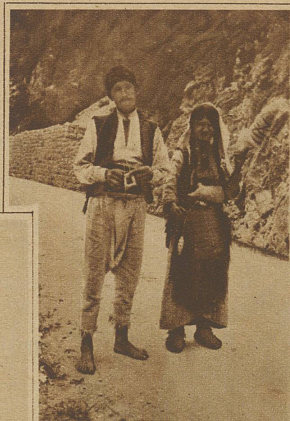
Strickender Bauer und spinnende Bäuerin auf der Straße im Urbas-Tal

sächlich fertig. Jetzt kann ich ja davon reden. Mein rechter Fuß zittert nicht mehr, außerdem be-treibt mich aufs lieblich-würdigste die Frau Wirtin vom Hotel Union in Ljubliana (Laibach). Natürlich eine Schweizerin aus dem Rheintal. Sonderbar, daß ich nach Südslawien fahren mußte, damit es mir auffalle, was für ein herrlich helles A diese Rheintaler sprechen.