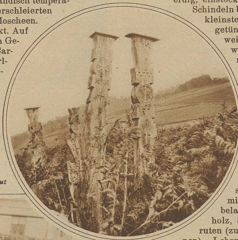
Serbischer Friedhof bei Klju

Heute geht's nach Bosnien. Der Esplanade-Portier schwärmt mir da südländisch temperamentvoll etwas vor, von verschleierte Türkinnen, Harems und Moscheen. In aller Frühe wird getankt. Auf guter Straße, wieder durch Getreidefelder, geht's nach Carlovac. Auf deutsch: Karlstadt. Ueber einen ungarischen Namen verfügt es auch noch. Der Größe und Bedeutung nach dürfte es mit einem auskommen. Hier wächst wieder einmal der «beste Wein», erzählt der Ober vom Zorin Dom, das ist das carlovacer Kasino. Die Trauben