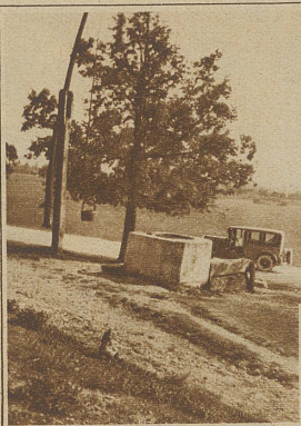
Ein typischer Ziehbrunnen mit Gegengewicht

Mit guten Ratschlägen, daß Pivo, Bier — Vino, Wein — levo, destino links und rechts — pravo grade aus und was so Worte sind, die ein Autofahrer brauchen kann, entläßt uns Mme. Rist, die liebenswürdige Unionwirtin zu Laibach. Es geht gegen Zagreb (Agram). Zu den Weizen- und Maisfeldern gesellen sich Hanf- und Hedenflanzungen. Melonen-, Paprika- und Kürbisfelder sorgen für Abwechslung. Endlos erscheinen diese Aecker. Links, ganz fern, leuchten die Schneefelder der Karawanken. Auf der rechten Seite zeigen sich deutlich wahrnehmbar, die weißlichen Dinarischen Alpen. Die Landschaft ist nicht mehr so eintönig eben. Auf Hügeln stehen Wallfahrtskirchen oder mächtige Stiftsbauten. Gegen Abend wird Zagreb erreicht. Hotel-, Benzin- und Garagen-Affichen lassen die Großstadt in der Nähe vermuten. Dafür wird die Straße bedenklich. Ein Schlagloch neben dem andern. Pfütze neben Pfütze, meterhoch spritzt das Wasser. Die Straße scheint vor Tagen einem Trommelfeuer ausgesetzt gewesen zu sein. Ein Bummel durch die Stadt zeigt südländisches Leben und Treiben. Musik, Kaffeehäuser, Tratsch, elegante Frauen und dito Herren. Wir fangen an Respekt zu bekommen vor den Südslawen. Wenn uns am Abend vorher das bedeutend kleinere Ljubliana als kleines Babel vorkam, so ist Zagreb dessen ältere Schwester. So ein Kabarett-Programm beginnt erst nachts 12 Uhr, um so gegen vier zu