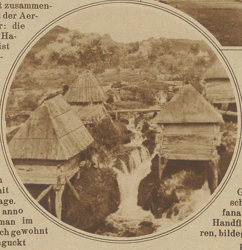
Ein Objekt für Landschaftsmaler. Kleine Mühlen, die durch Abflüsse aus den Plitvicer-Seen getrieben werden

ersten verschleierte Haremsdamen! Und das ist alles. Diese Kattunfähnchen? Diese schwarzen Lappen über das Gesicht? Allah! Wo sind die Schleier? Wo sind Perlenschnüre und gleißender Tand? Netter Zauber, netter Orient, das!! Mit einer Illusion ärmer wird der Gasthof aufgesucht. Wir bekommen das «Fürstenzimmer» mit Balkon in der 1. Etage. Ausstaffiert im Stil anno 1860. Damals mag man im Zürcheroberland ähnlich gewohnt haben. Wo man hinguckt Blumen — nichts wie Blumen — Blumen in phantastischen Füllhörnern, Blumen im Papierkorb, Blumengirlanden über dem goldbronzenen Spiegel. Und alle diese Blumen aus dauerhaftem, verschiedenfarbigem — Papier. Betten aus Blech, mit Abziehbildchen d'rauf — Troubadour — Wilderer — ideale Alpenlandschaft mit Wasserfall — alles Bilder, wie sie heute noch bei unseren Herren 5 Rappen-Karussellbesitzern sehr in Mode ist. Als Garage wird ein offener Holzschopf angewiesen. Beruhigend wirkt, wie der Hotelier einen bissigen Köter dazu bindet. Die «Hotelleitung» be-