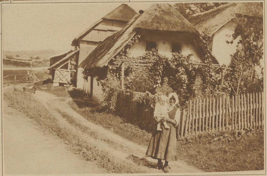
Rechts: Idyllisches Bauernhaus in Bosnien

Ganze Familien bilden mit ihren Reittieren kleine Karawanen. Die alten Pferdchen scheuen vor dem neumodischen Benzinvehikel nicht, wohl aber ihre Söhne und Töchterchen. Gelungen hüpfen sie links und rechts in die Felder. Damit sie nicht verloren gehen, hat jedes eine Treichel am Hals. Lieb sind die Bergbewohner; wenn die Sprache nicht mehr reicht, so treten lebhaft die Hände zur Verständigung in Aktion. Einer gibt uns zu verstehen, daß er kriegsverwundet in Luzern gelegen, deutet an den Kopf und sagt: Kopfschuß — Lucerna. Damit ist sein deutscher Sprachschatz erschöpft. — Bis hieher haben die Wegweiser gute Dienste geleistet. Ein Minister hatte nun den neckischen Einfall, die Ortsnamen mit kyrillischen (wie russisch) Lettern hinzuzumalen. Natürlich kommen wir nicht mehr draus und landen bei einem Postomnibus, der anscheinend kaputt. Ein Pfarrer wettet und schimpft um ihn herum. Auf unsere bescheidene Frage nach dem nächsten Ort «Bihac», kommt eine serbische Antwort, einem