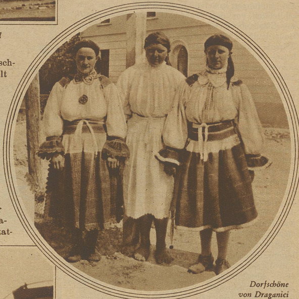
Dorfschöne von Draganici

Die Karawanken, über die der Loibl-Paß führt, bilden das letzte Bollwerk der Alpen gegen den Balkan. Von Klagenfurt bis zur österreichischen Grenze geht es noch. Nachher wird's toll. Das Perfide an dieser Steigerei: die 36% liegen immer hübsch in den Kurven. Die Straße ist ausgezeichnet, natürlich wenig befahren. Die Gegend war anno 1920 noch Kriegsgebiet. Rechts und links Häuserruinen. Endlich sind wir offen. Adelgunde kocht. Ein wunderbarer Blick tut sich auf. Senkrecht uns zu Füßen liegt in praller Mittagssonne das Savetal. Bedächtig zirkeln wir um die Kurven herum. Daß auf dieser Straße während des Weltkrieges Hunderte von Lastwagen in die tiefen Schluchten stürzten, leuch-