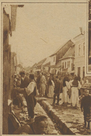
Straßenbild aus einem kleinen Dörfchen, das zur Geburtstagsfeier des Kronprinzen beflaggt hat