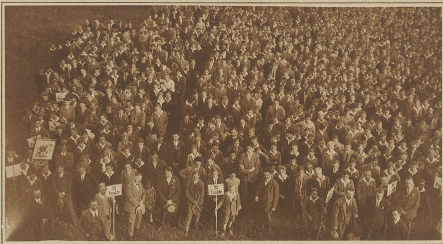
Die Preisträger des Knabenschiessens warten auf ihre Gaben