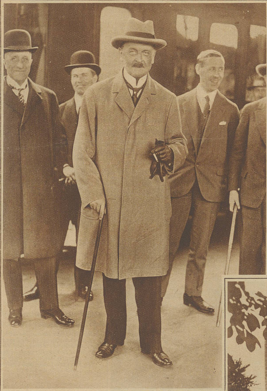
Bild links: Graf Brockdorff-Ransau , deutscher Botschafter in Moskau, ist im Alter von 60 Jahren plötzlich gestorben. Mit ihm verliert Deutschland einen seiner fähigsten Diplomaten