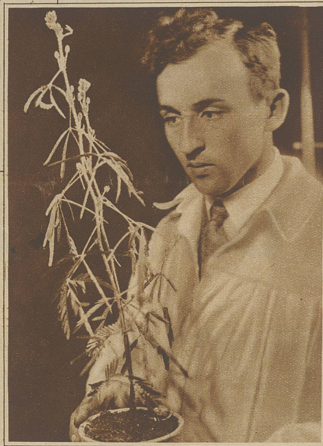
Die geretzte Pflanze im Schlafzustand

Die in Brasilien beheimatete Mimose hat die Eigenschaft, ihre doppelt gefiederten Blätter bei Berührung, Stoß oder Brennreiz mit Hilfe von Gelenken sogleich zusammenzulegen. Die ganze Pflanze verfällt in den sogenannten Schlafzustand, aus dem sie nach etwa 15—20 Minuten wieder in die gewöhnliche Stellung übergeht