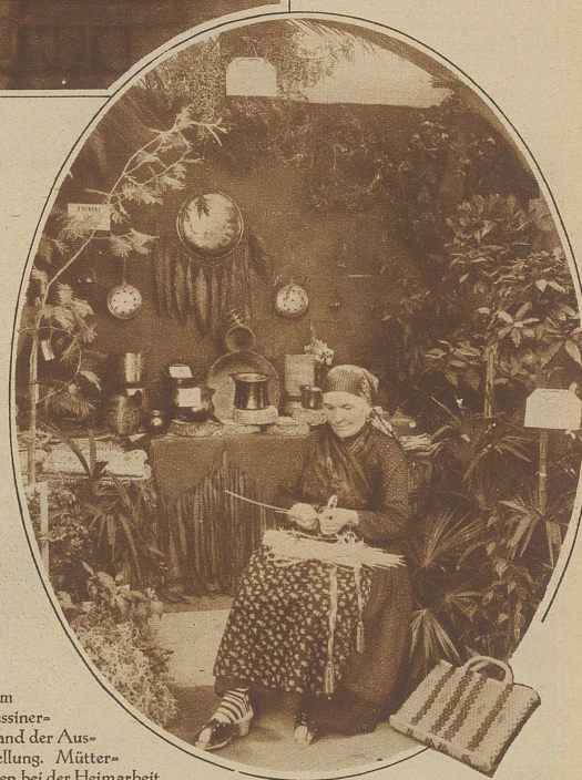
Am Tessinerstand der Ausstellung. Mütterchen bei der Heimarbeit