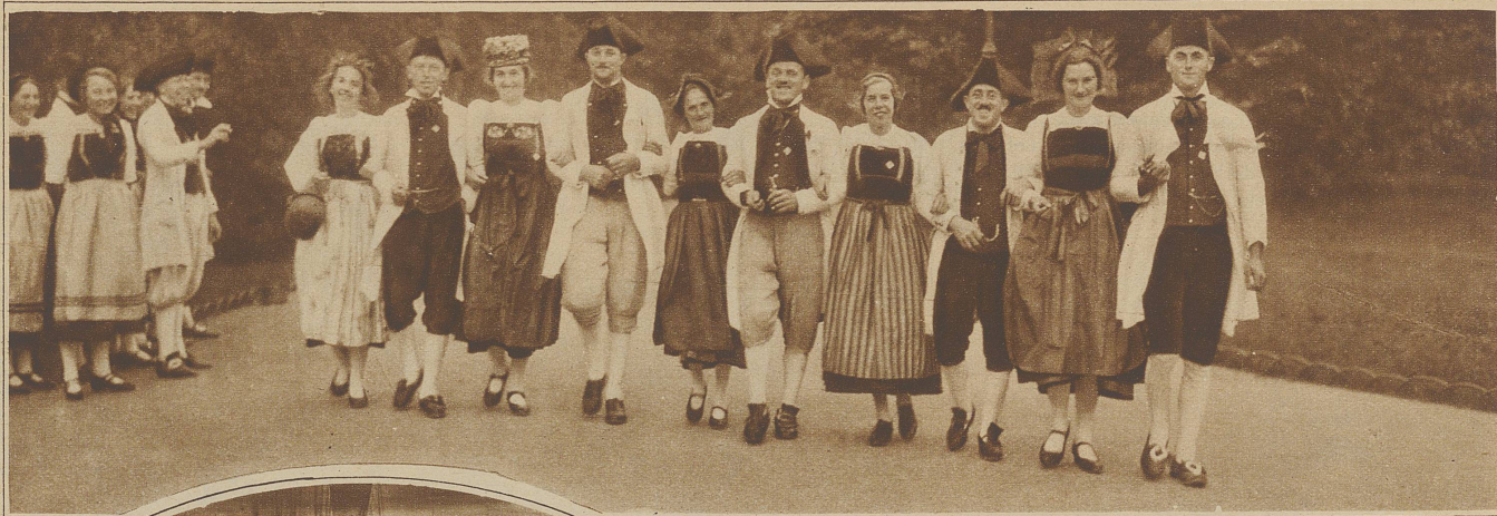
Fröhliche Zürchergruppe, eine Wehntaler Bauernhochzeit vor 150 Jahren darstellend