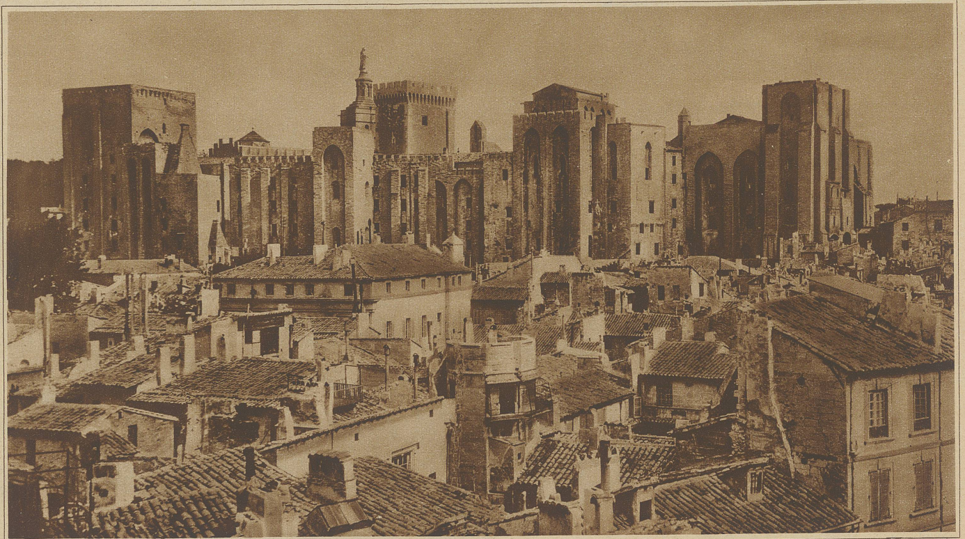
Die ehemalige Burg der Päpste in Avignon, von Osten gesehen

gend, die Idee zu seinem «Inferno» gegeben haben. Doch hat auch an unzähligen andern Stellen dieses von intensivem Leben durchpulsten Landes das Mittelalter eindrucksvolle Visionen hinterlassen, wie in dem Ruinenkomplex von Mont-Majour bei Arles, dem alten Schloß von Tarascon und den vielen drohenden Festungen auf dem rechten Rhoneufer, von Beaucaire bis Villeneuve. Ein einzigartiges Glanzstück aber sowohl der profanen als auch der kirchlichen Baukunst des Mittelalters stellt Avignon dar, das während des größten Teiles des 14. Jahrhunderts die Päpste in seinen Mauern beherbergte. Nachdem ihr Aufenthalt in dieser Grenzstadt der von einem treuen Vasallen der Kurie verwalteten Grafschaft Venaissin erst als vorübergehend gedacht worden war, sahen sich die Kirchenfürsten infolge der ständigen Unruhen in Rom bald veranlaßt, sich in Avignon dauernd einzurichten. Das Ergebnis dieses Entschlusses ist die noch heute stehende Burg der Päpste, die ihresgleichen auf der Welt nicht hat. Von verschiedenen Päpsten ohne festen einheitlichen Plan errichtet und ergänzt, ist die Bauart dieses Schlosses ebenso kraus wie die Geschichte jener Zeit. Nach der erneuten Uebersiedlung der Kurie nach Rom am Ende des 14. Jahrhunderts noch Sitz von Legaten und Vizelegaten, ist die Residenz und mit ihr die zeitweise