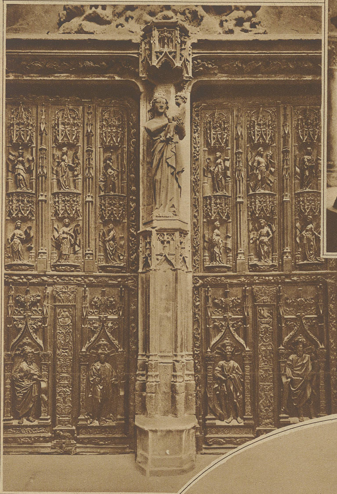
Holzschnitzereien am Portal der Kathedrale von Aix in der Provence

zeln zu schlagen vermöchte, wie sie denn auch nur in ihrer letzten, schon dem Uebergang zuneigenden Form Aufnahme gefunden hat. Die größte Zahl der kirch-