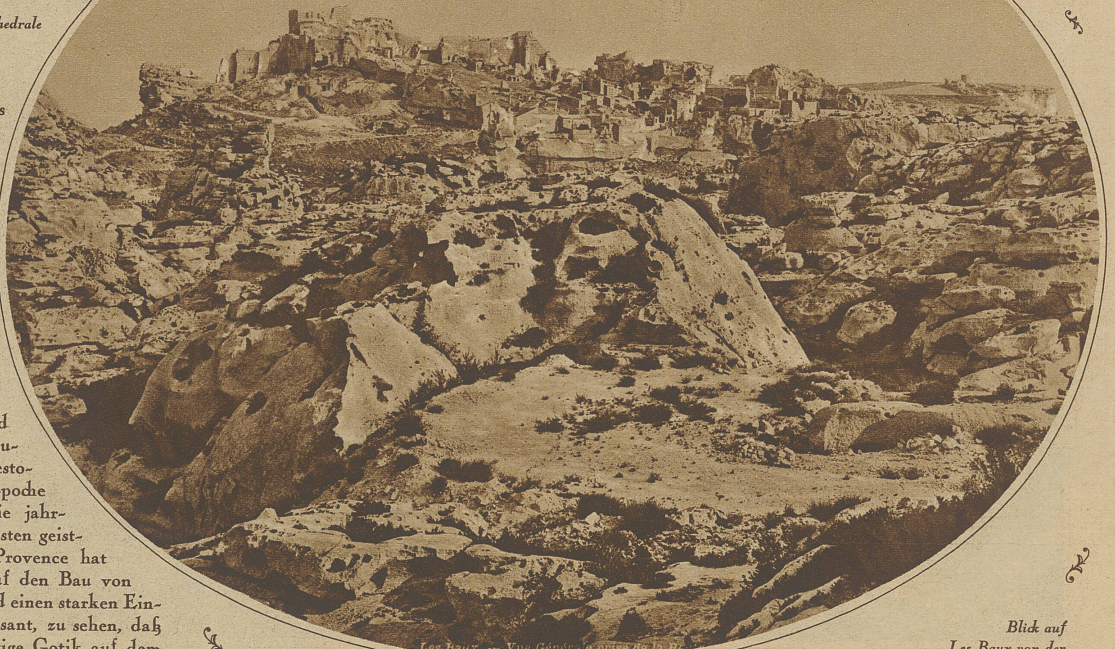
Les Baux. — Vue générale prise de la rue

Die neuen Filme sollen einen erstaunlichen Fortschritt bedeuten. Es sind Dramen und Erzählungen und stellen alles in Lebensgröße dar