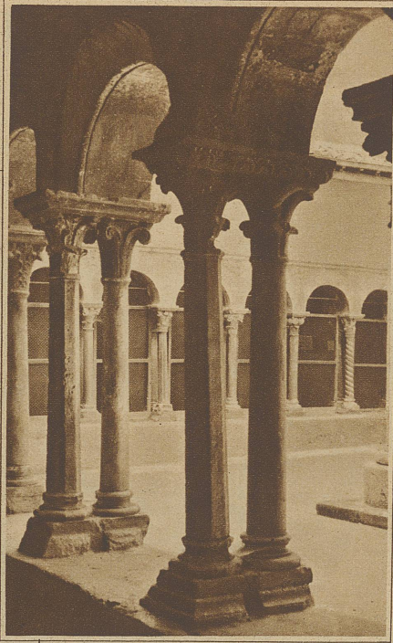
Kreuzgang in der Kathedrale von Aix in der Provence

sind auch die Schilderungen des großen Dichters der Renaissance, Petrarca, aufzunehmen, der in seiner Eigenschaft als Italiener der Stadt des Exiles der Päpste wenig günstig gesinnt war und in der nahen Einsiedelei der Fontaine-de-Vaucluse sich einen Zufluchtsort suchte, in dem seine unsterblichen Lieder an Laura entstanden. Erst in neuerer Zeit hat man sich wieder bemüht, das Bauwerk als geschichtliches Monument zu pflegen und ist bei diesem Anlaß auf bedeutenden bildnerischen Schmuck gestoßen, der von der Kultur jener Epoche beredtes Zeugnis ablegt. / Die jahrzentelange Anwesenheit des höchsten geistlichen Würdenträgers in der Provence hat natürlich auch nicht verfehlt, auf den Bau von Kirchen und Klöstern der Gegend einen starken Einfluß auszuüben. Dabei ist interessant, zu sehen, daß die damals im Norden so mächtige Gotik auf dem Boden der alten römischen Provinz nie recht Wur-