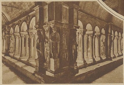
Der prächtige Kreuzgang von St. Trophime in Arles

röschenschlaf versunkenes Stück Mittelalter. Kaum eine Anhöhe, die nicht zum mindesten Reste wuch-