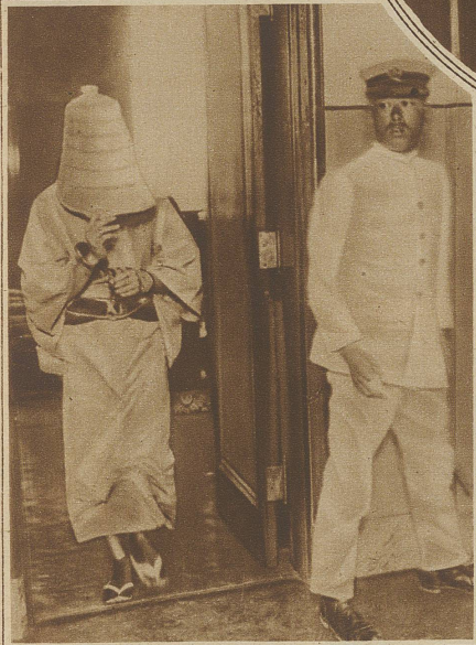
Gefangene in Tokio. Vor Eintritt in das japanische Gefängnis bekommt jeder Verbrecher einen Korb über den Kopf gestülpt, der sein Gesicht vollkommen verbirgt