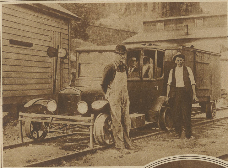
Auch so etwas gibt es noch in Amerika. Zwischen zwei Städten in Oregon wird der Personen- und Gepäckverkehr mit diesem altmodischen Vehikel bewerkstelligt. An dem, auf Eisenbahnschienen laufenden Fordwagen, wird hinten der primitive Gepäckwagen angehängt