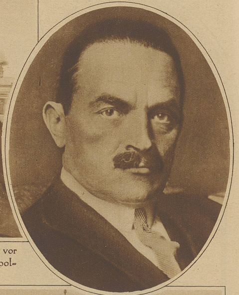
Bild im Oval: Der polnische General Zagorski, der vor einiger Zeit spurlos verschwunden ist, soll von hohen polnischen Offizieren erschossen worden sein