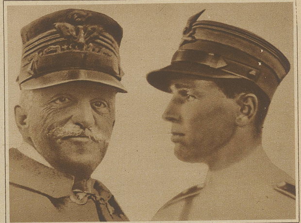
Rücktritt des italienischen Königs? Seitdem sich Mussolini vor 14 Tagen zum Cäsaren erheben ließ, verbreitet sich hartnäckig das Gerücht vom bevorstehenden Rücktritt von König Viktor Emanuel. Das Dekret der Kammerauflösung und seiner nachherigen Abdankung soll schon unterschrieben sein. Als Nachfolger kommt aber nicht Kronprinz Umberto in Betracht, der dem Diktator nicht genehm ist, sondern der Herzog von Apulien (Bild rechts), der älteste Sohn des Herzogs von Aosta