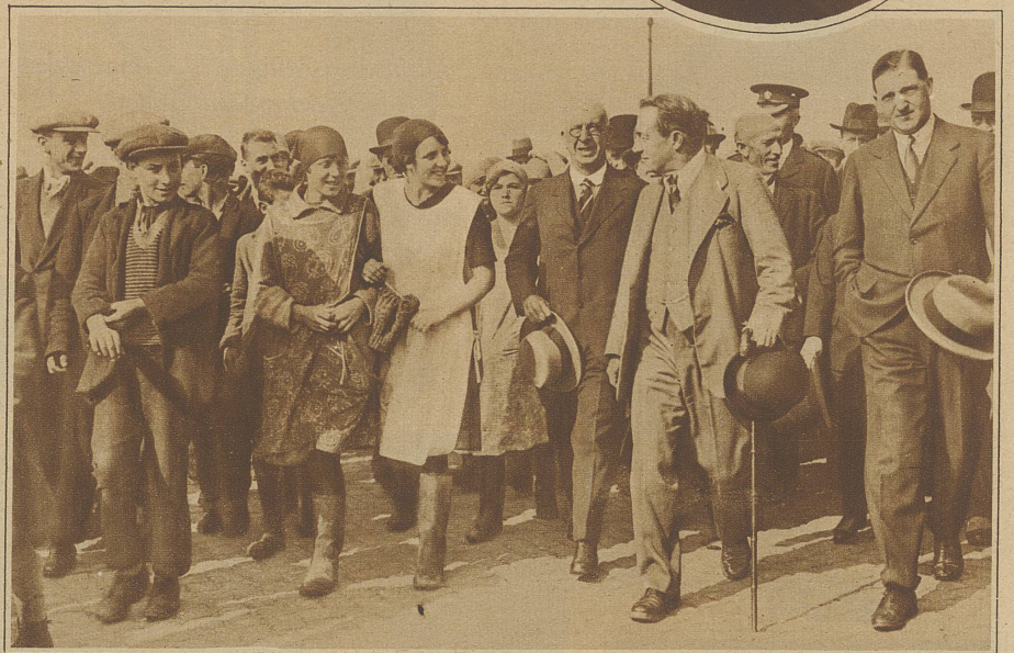
Der Diplomat auf Urlaub. Baldwin schäkert in Yarmouth mit schottischen Fischermädchen