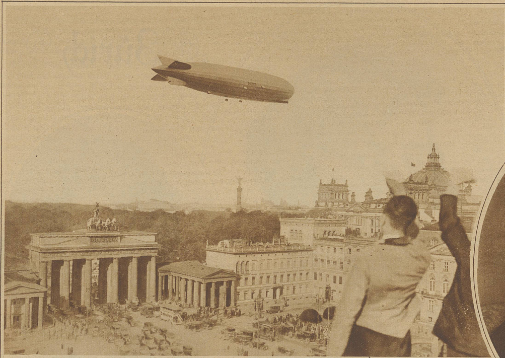
Bild links: Der neue Zeppelin flog anlässlich des 34-stündigen Distanzfluges auch über Berlin. Das Bild zeigt ihn über dem Brandenburger Tor