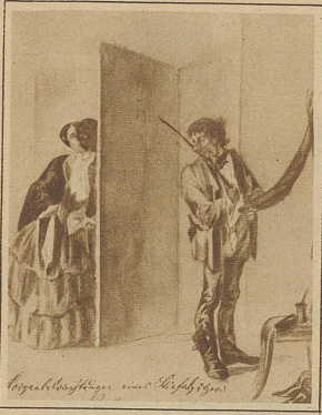
Morgenbetrachtung eines Stiefelpußers Maler unbekannt

Wie man den Ernst eines Dichters nicht anzweifelt, wenn er eine Satire schreibt, so wird man auch den Maler nicht verächtlich betrachten können, der mit Humor seine Darstellungen würzt. Die Karikatur hat in den verschiedensten Zeiten ihre Rolle gespielt und nicht selten hat sie eine nicht zu unterschätzende gesellschaftskritische Aufgabe