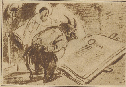
Hengeler: Teufel und Oasig

ist und darin den Karikaturisten ein weites Betätigungsfeld und einen fast grenzenlosen Wirkungskreis bietet. + Es gibt kein Gebiet, das von dem bildlich dargestellten Humor nicht betroffen werden könnte. Die Kunst da-