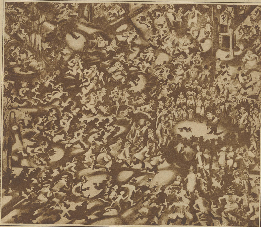
Wolff: Der Aufruhr

ner eigentlichen Großmacht entwickelt, nachdem sie anfänglich nur bei den Engländern, dann bei den Franzosen und erst zur Zeit Napoleons in Deutschland sich auf eine breite, alle in der Öffentlichkeit stiebenden Persönlichkeiten umfassende Basis gestellt hatte. + Der Erfolg der Karikatur begründet sich auf der richtigen Einschätzung unserer Vorliebe, über die Schwächen anderer zu lachen. Durch die Darstellungen werden uns diese in ihrer ganzen Lächerlichkeit vorgeführt und durch die Uebersteigerung oft vom eigentlich Traurigen ins Komische oder Grotteske übertragen