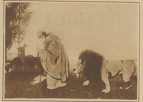
Hengeler: Der Einsiedler und seine Freunde

bei besteht ja immer nur darin, wirkliche Züge oder Eigenschaften zu erkennen und ihre Bedeutung oder Funktion zu überschätzen. Das beliebteste Gebiet war von jeher die menschliche Schwäche und das Laster. In unserer Zeit kommt dazu noch die Aktualität und die Zukunfts-träumerei, die einerseits durch die Mode, den Wandel im gesellschaftlichen Leben, andererseits durch die technischen Erfolge und ihre Weiterführung gespeist wird. + Die Form und Ausdrucksweise der Karikatur wird