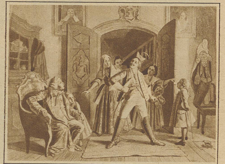
Hasenclever: Jobs Rückkehr von der Universität