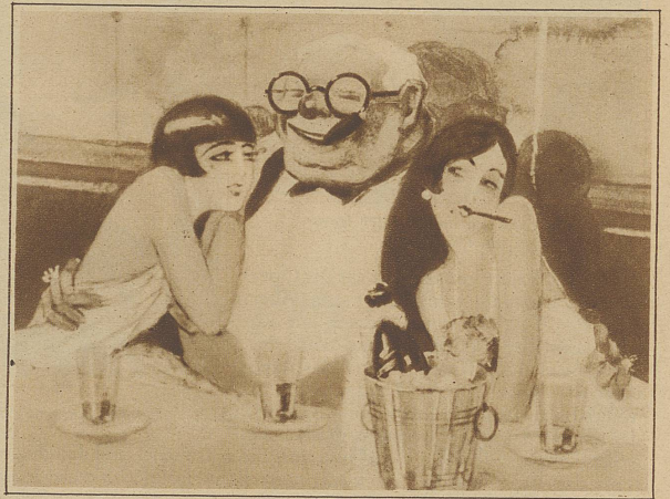
Vennieux: Der allmächtige Dollar

erfüllt. Noch selten aber hat sich auf diesem Gebiete so sehr ein Spezialistentum berangebildet wie in unserer Zeit, die mit illustrierten Zeitungen und Zeitschriften so reich gesegnet