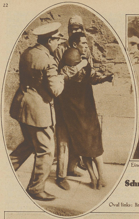
Eine Mutter, die ihre drei Kinder vermisst, versucht ins Theater zu gelangen

Unteres Bild: Die Springflut hat eine Yacht an Land geworfen