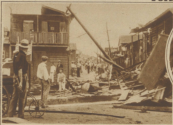
Eine Straße in San Juan (Porto Rico)