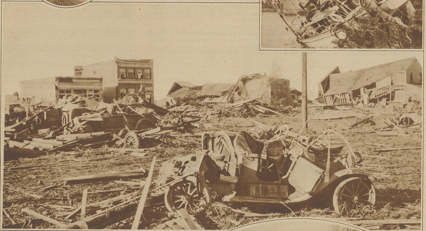
Die Verwüstungen in Süd-Dakota