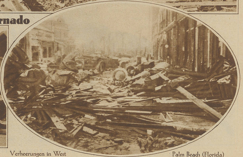
Verheerungen in West