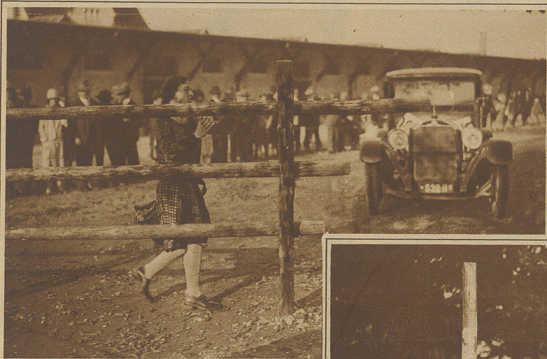
Die Konkurrenten haben vor eine Barriere zu fahren, sie zu öffnen, durchzufahren und sie wieder zu schließen