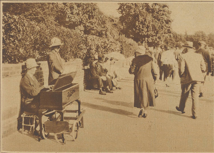
Die Kunst geht betteln. Auch in London sind die Bühnenkünstler nicht auf Rosen gebettet. Das Bild zeigt eine bekannte Opernsängerin auf der Strandpromenade in Reemond bei London, die ihr Gesicht durch eine Maske verdeckt hält, um nicht erkannt zu werden. Sie singt mit geschullter Stimme Arien aus Opern und lebt von den Almosen, die ihr von den Vorübergehenden gegeben werden