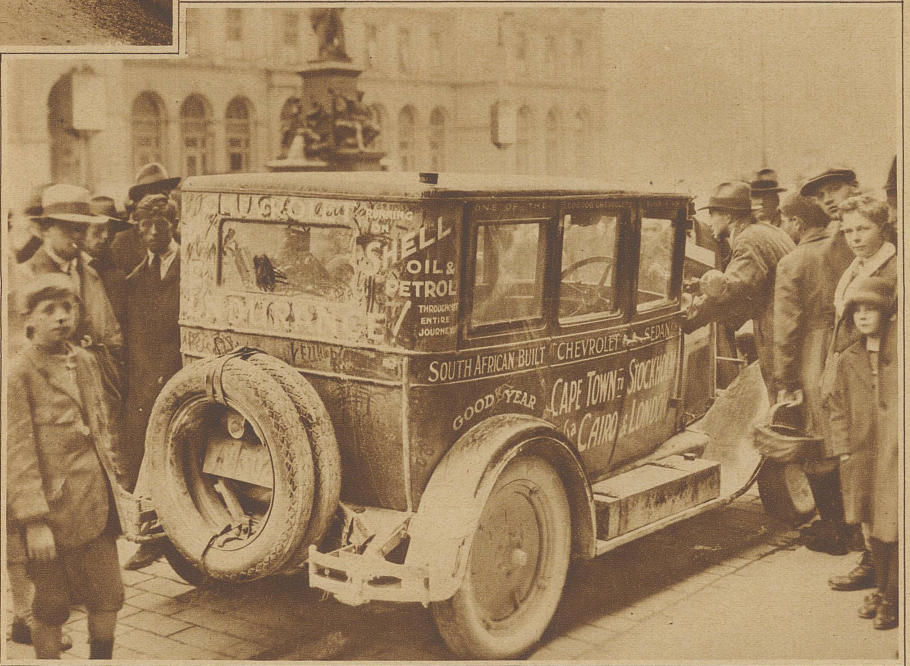
Ein Wagen der Chevrolet-Expedition von Kapstadt nach Stockholm auf dem Bahnhofplatz in Zürich. Bis jetzt wurde eine Strecke von etwa 20000 km zurückgelegt, ohne daß irgendwo ein Wasserweg benötigt worden wäre