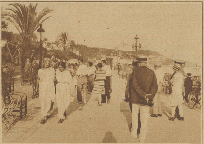
Herbsttag auf der «Promenade des Anglais» in Nizza, wo man sich mit leichten Toiletten zu überbieten sucht. Herren in Hemd und Hose und Damen in griechischer Toga