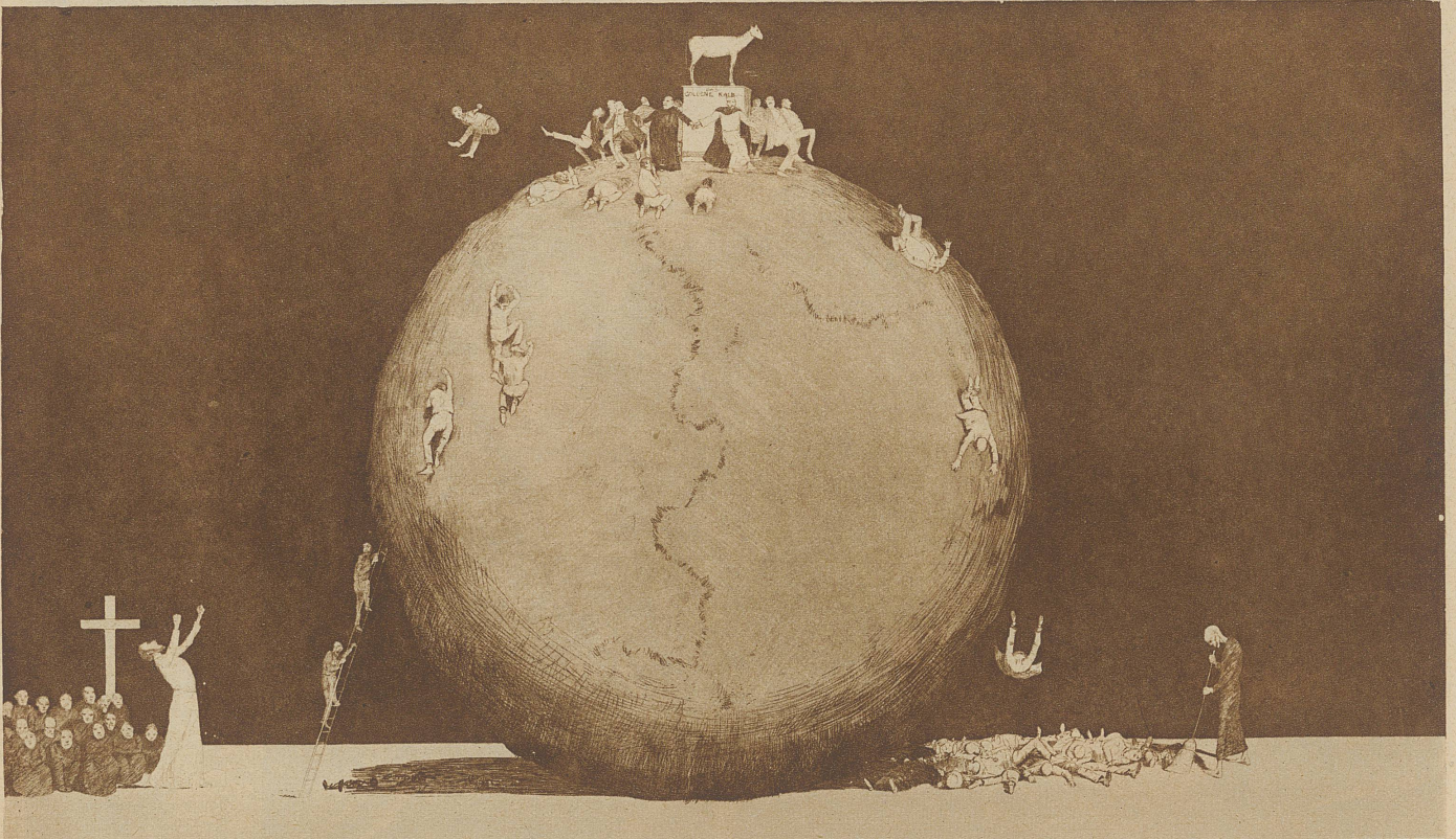
RADIERUNG VON JOSEPH UHL