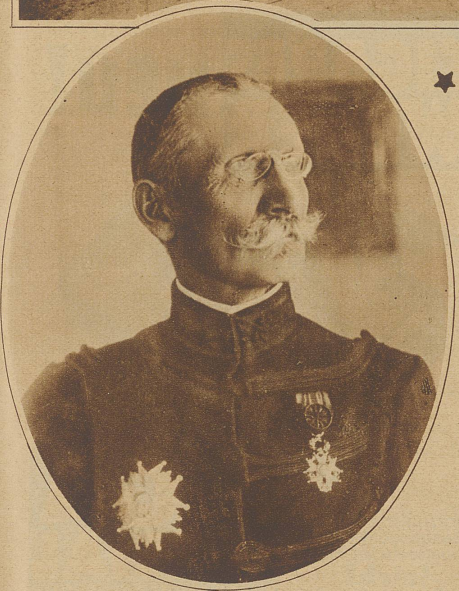
Der französische General Percin ist in Paris 82-jährig gestorben. Der Verstorbene spielte im Weltkrieg als Armeeführer eine große Rolle und trat nun in den letzten Jahren als pacifistischer Schriftsteller hervor