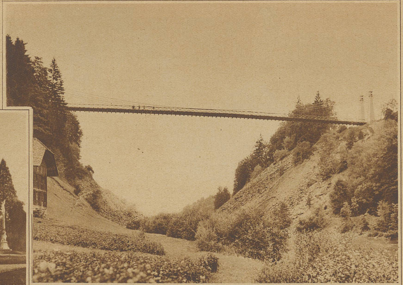
Die Hängebrücke von Corbières, welche die Sarine (Straße Freiburg-Bulle) überspannt, soll abgebrochen und durch eine neue ersetzt werden, da sie den Anforderungen des starken Verkehrs nicht mehr gewachsen ist. Schwere Camions müssen heute den Umweg über Broc oder Posieux machen. Erbaut wurde die Brücke in den Jahren 1836-38.

Schloß Mainau auf der gleichnamigen Insel im Bodensee, das dem kürzlich verstorbenen Großherzog von Baden gehörte, ist durch Erbschaft an seine Schwester, die Königin Viktoria von Schweden übergegangen. Schloß Mainau ist seit Jahren der Lieblingsaufenthalt der schwedischen Königin