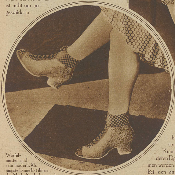
Würfelmuster sind sehr modern. Als jüngste Laune hat ihnen die Mode Niederlassung bewilligt auf dem Ueberschu. Der Schuh selbst besteht aus einem Gumminaterial, das im Effekt von Reptil-Leder gepreßt ist

Angesichts der Feinheiten und Entwicklungsmöglichkeiten, die eine neue Zeit dem weiblichen Geschlecht beschert hat, wird der einst stark umstrittene Wunsch: lieber Mann anstatt Frau zu sein, am ehesten noch im Hinblick auf Lohn und auf Beförderungsfragen in höhere Positionen laut. + Dennoch hört man selten die Frauen dem Schicksal dafür danken, Frau zu sein. Ein allzusehr auf die Stellung des Mannes im Leben gerichteter Blick hat eine große Anzahl Frauen vergessen lassen, in wieviel Dingen des praktischen Lebens die Frau dem Manne gegenüber ganz entschieden im Vorteil ist. So veranlaßt noch heute das alte Uebel der «abgerissenen Knöpfe» manchen Mann zur Heirat. Er ist nicht nur ungeschickt in