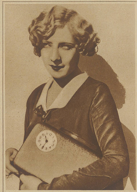
Ob er versteht, was die Uhr geschlagen hat?

entsprechende Quantum Lux in sehr heißem Wasser aufzulösen; kaltes Wasser beizufügen bis die Lösung lauwarm ist und diese dann zu Schaum zu schlagen. Das Kleidungsstück wird gereinigt durch wiederholtes Eintauchen und indem an