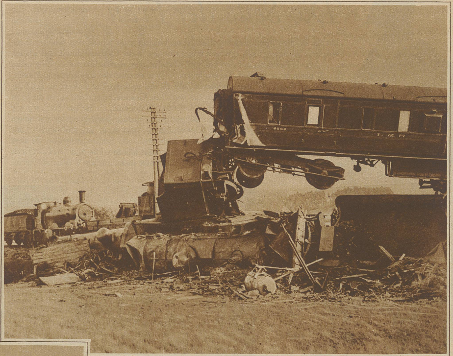
Ein Personenwagen wurde auf die beiden gestürzten Lokomotiven hinaufgeschoben