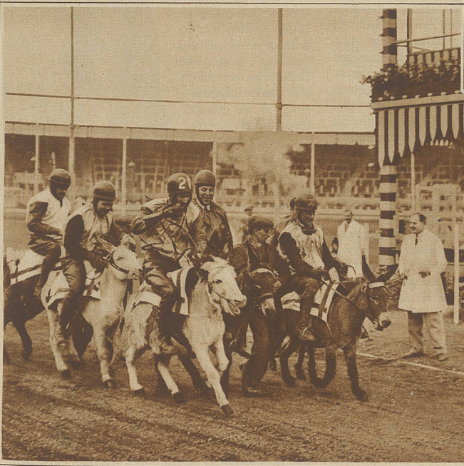
Originelles Eseltrennen in England. Wie viele der Reiter ins Ziel einliefen, wird nicht mitgeteilt