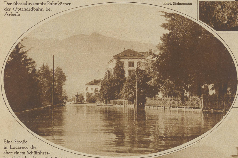
Eine Straße in Locarno, die eher einem Schiffahrtskanal gleicht

Untenstehendes Bild: Die Schiffspassagiere können nur über einen langen Steg trockenen Fußes ans Land gelangen