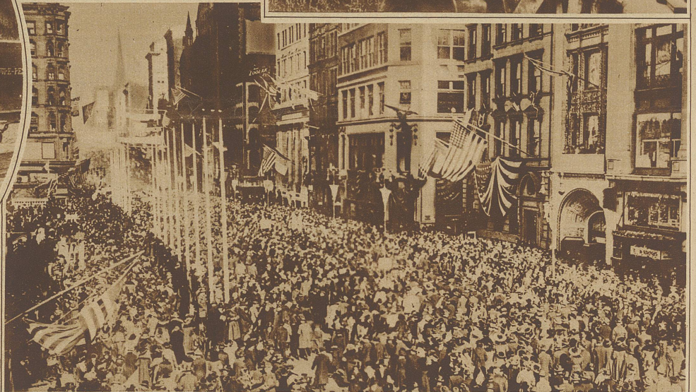
Rechts: Die riesigen Menschenansammlungen in den Straßen von New York nach der Proklamation des Waffenstillstandes