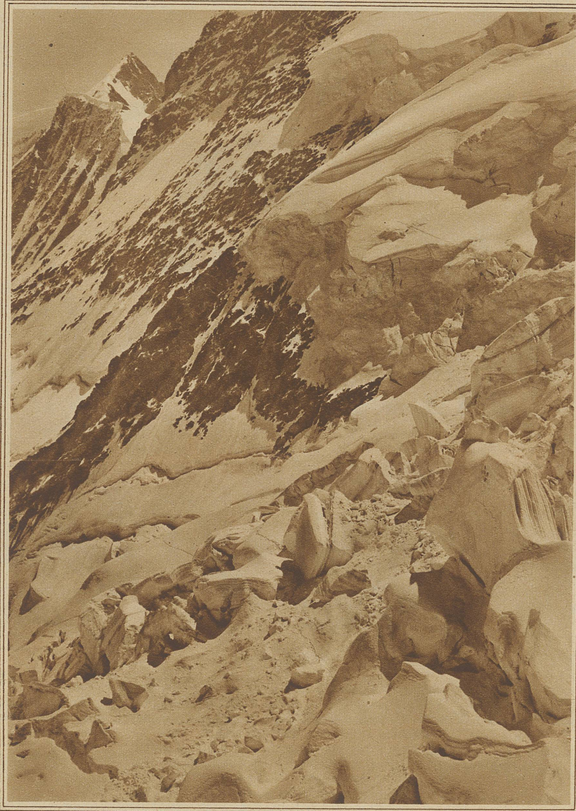
Blick von der Station Eismeer der Jungfraubahn auf das Eismeer und das Große Fiescherhorn

Erleichtert atme ich auf und kaufe einen herrlichen Sommerstrauß. «Wo haben Sie nur die wunderbaren Blumen her?» schmeichelt die Dame. — «Ich habe sie mir frisch vom Gärtner auf dem Feld schneiden lassen.» — «Wie schön, wie sinnig! Denken Sie nur, Ihr Freund hatte gestern die Geschmacklosigkeit, mir Blumen mitzubringen, die er drüben an der Friedhofmauer gekauft hatte.» — Da lächelte ich gemein und dachte: Wir sind es doch wert, daß wir sterben müssen.