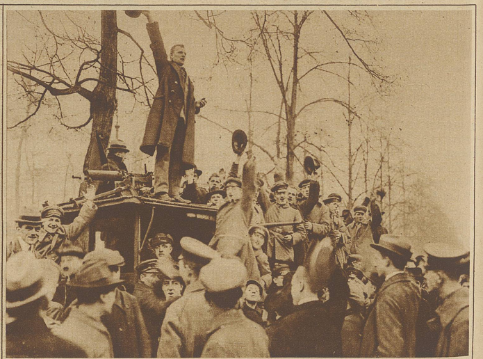
Auf dem Rückmarsch. Das erste Hoch auf die Republik