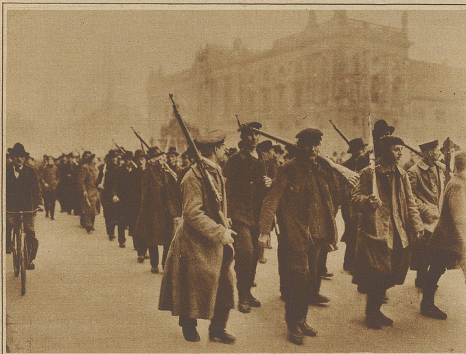
Bewaffnete Arbeiterbataillone marschieren über den Schloßplatz in Berlin