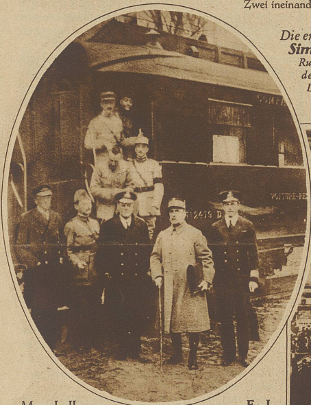
Marschall Foch vor dem historisch gewordenen Speisewagen nach der Unterzeichnung des Waffenstillstandes