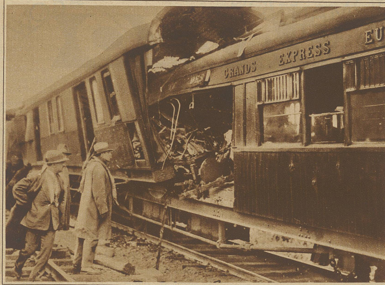
Zwei ineinandergeschobene Wagen. Im Schlafwagen wurden 10 Personen getötet