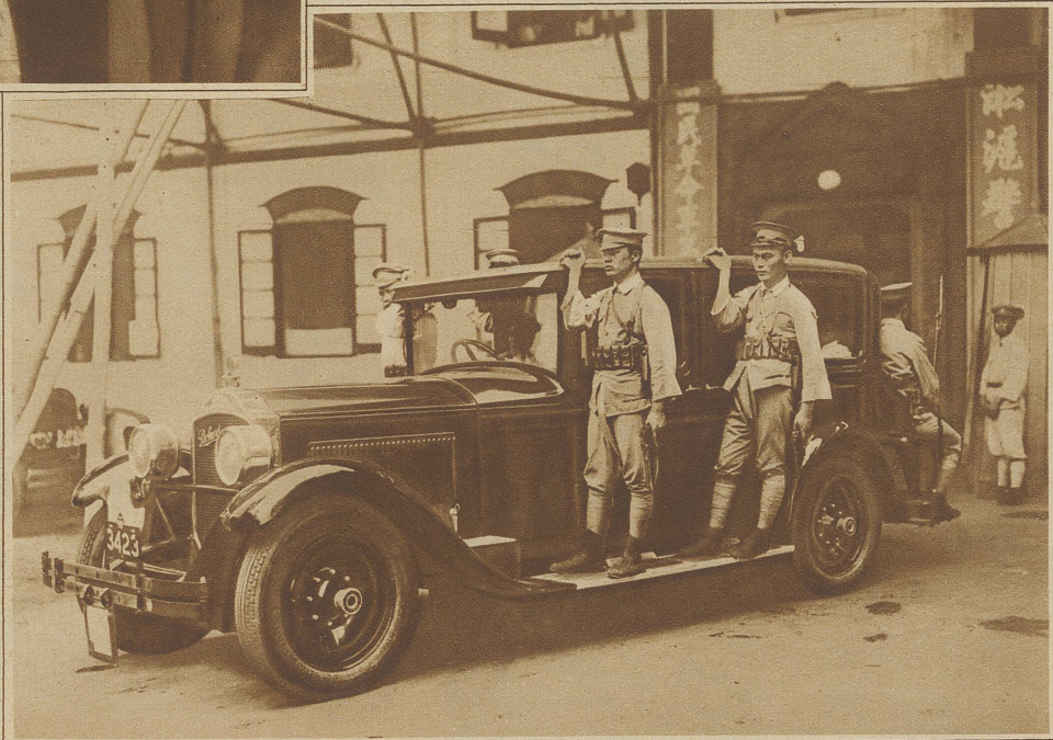
In China an der Spitze der Regierung zu stehen, gehört offenbar nicht zu den Annehmlichkeiten des Lebens. So hat der General der nationalistischen Armee, Chang-Kai-Schek, sich ein Auto bauen lassen, das hinten zwei Sitze für bewaffnete Begleiter hat. Außerdem sind an den Seiten Handgriffe angebracht, damit auch auf den Trittbrettern je 2 Soldaten stehen und ihn auf der Fahrt begleiten können