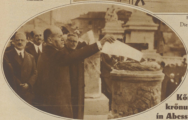
Der Duce übergibt die Titel den Flammen