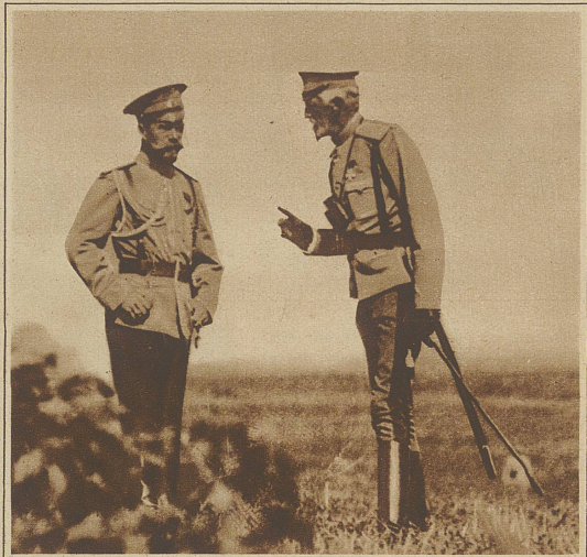
Unten: Großfürst Nikolaus Nikolajewitsch (ein Enkel Nikolaus I.), im Weltkriege als Oberkommandierender der russischen Armee bekannt geworden, ist als Leiter der Vereinigung russischer Emigranten zurückgetreten. Dieser Entschluß ist angeblich darauf zurückzuführen, daß sich die Aussichten auf die Thronfolge in Rußland mehr und mehr verringern. Nikolajewitsch im Gespräch mit dem später ermordeten Zaren, während des Weltkrieges