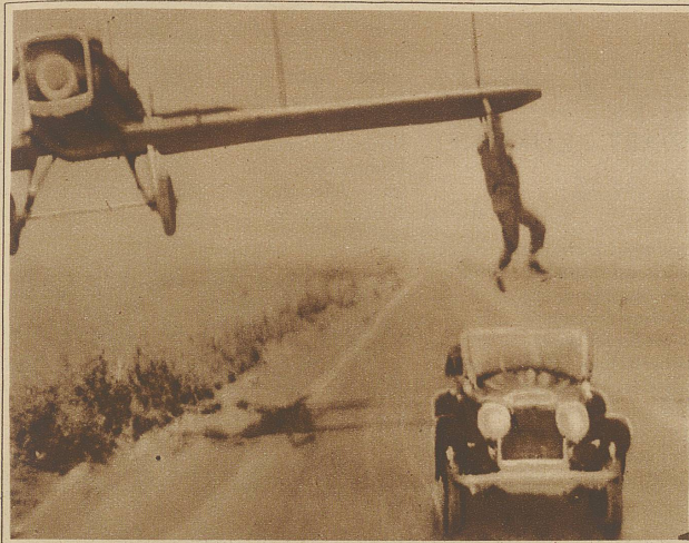
Ein tollkühner Sprung. Der amerikanische Filmartist Reed Howes leistete sich das halbschwerere Stückchen, von einem in rasender Fahrt über einer Landstraße fliegenden Flugzeug aus in ein darunter mit annähernd gleicher Geschwindigkeit fahrendes Auto zu steigen. Das Bild zeigt den Moment des «Umsteigens»