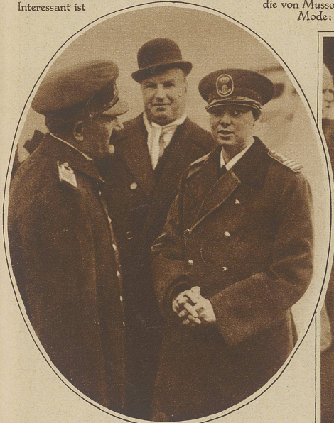
Die Tante des jungen Königs, Prinzessin Jleana, in der Uniform eines Marineoffiziers Rumänien feierte die 50jährige Zugehörigkeit der Dobrudja zum Königreich und gleichzeitig das einjährige «Regierungsjubiläum» des kleinen Königs Michael