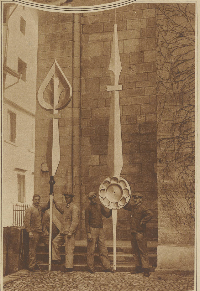
Rechts nebenstehend: Die beiden Zeiger, von denen der kleinere bei einer Länge von 4,80 m 74 kg wiegt, während der längere 92 kg wiegt und 6 m lang ist