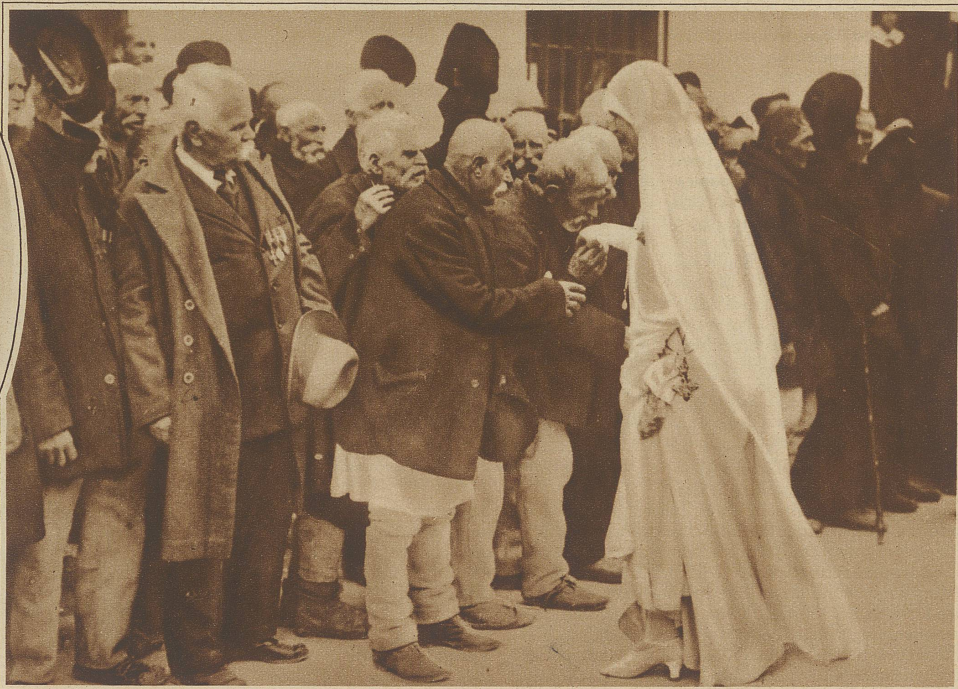
Rechts: Königin Marie begrüßt die an der Jubiläumsfeier teilnehmenden Veteranen