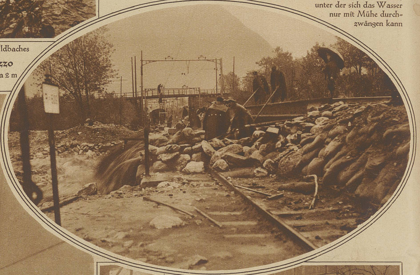
Die Das Geschiebefeld des vom Monte Arbino herunter kommenden Wildbaches Hochwasserverheerungen an der Gotthardbahn bei Molinazzo Bild rechts (im Oval): Die von den Bundesbahnen erstellte Notbrücke liegt etwa 2 m höher als die alte Trasse, an deren Freilegung gearbeitet wird