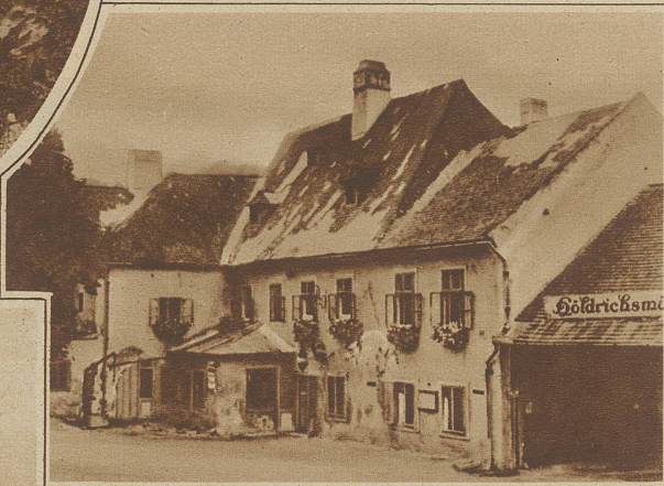
Die Höldrichsmühle in Mödling bei Wien, wo Schubert sein berühmtes Lied «Am Brunnen vor dem Tore» komponierte