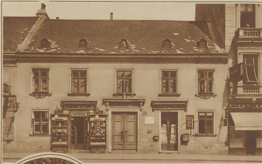
Schuberts Geburtshaus in Wien