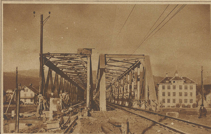
Die neue Brücke ist dem Verkehr übergeben worden; links daneben die weggeschobene alte Brücke