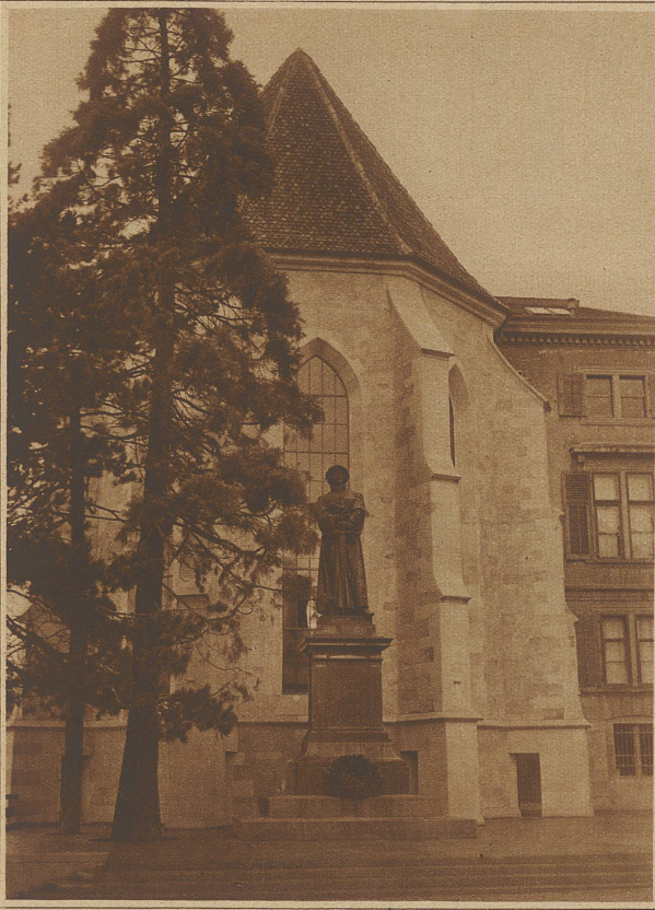
Links: Das Zwingliedenkmal vor der Wasserkirche in Zürich präsentiert sich seit der Umgestaltung seiner Umgebung bedeutend besser