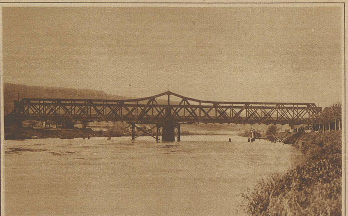
Auswechseln der Eisenbahnbrücke über die Aare bei Brugg. Die neue Brücke wurde direkt neben der alten montiert und in der Nacht vom 17. auf den 18. November an die Stelle der alten geschoben