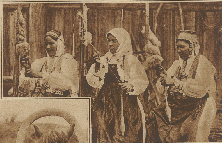
Tschuwaschische Bäuerinnen spinnen nach alter Weise ihren Flachs

lich verrichtet sie auch ihre ländliche Arbeit angetan mit der malarischen Tracht und behangen mit den schwe-