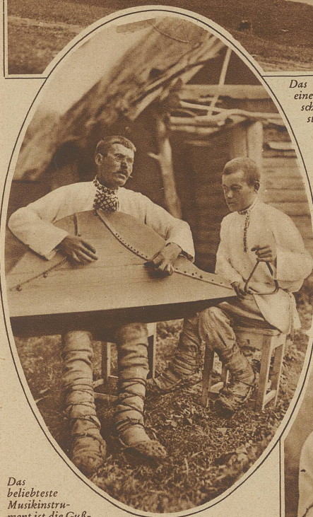
Das beliebteste Musikinstrument ist die Gusli, eine eigentümlich geformte Zither. Auf unserm Bilde spielt ein Blinder Volklieber, zu denen er auf dem Triangel begleitet wird

lich verrichtet sie auch ihre ländliche Arbeit angetan mit der malarischen Tracht und behangen mit den schwe-