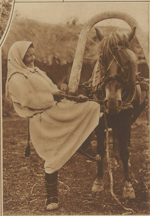
Einschirren des Gespanns

Die Frau teilt sich nicht nur in der Arbeit mit dem Manne, sondern sie hilft ihm auch die Geschicke des Landes lenken, sitzt mit ihm in den Sowjets und leitet Schulen und Les-