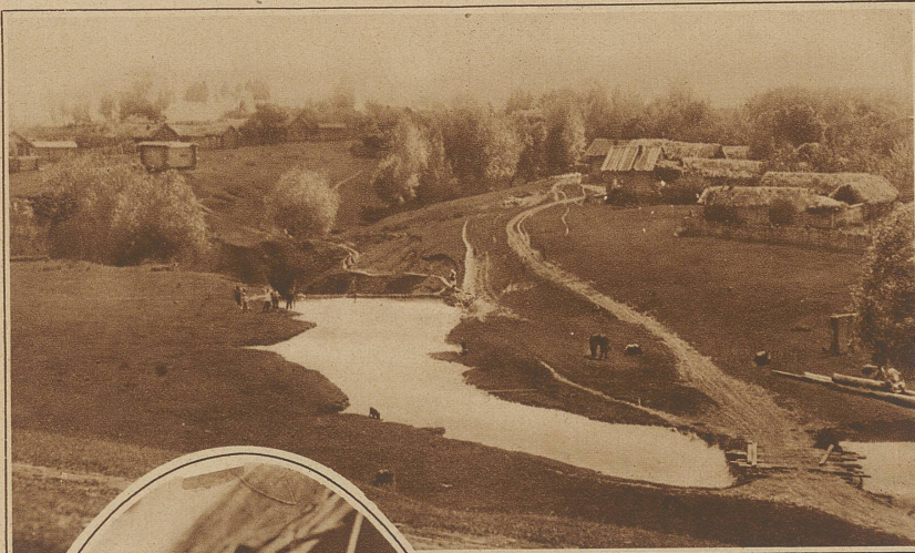
Das Dorf Kiwsertkasi, eine typische tschuwaschische Dorfanlage: Verstreute Häuser um eine Mulde ohne gemeinsame Straße

ren Ketten aus silbernen Münzen, die bei den Bewegungen klimpern und klingen wie gutgestimmte Glockenspiele. Von den Russen unterscheiden sie sich — wie übrigens auch die Männer — schon rein äußerlich durch den kräftigen, etwas gedrungenen Körperbau und die auffallend breite Kopfform. Aber noch mehr durch ihre Energie, die Beharrlichkeit ihres