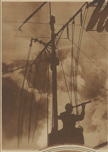
Sturm im Anzug