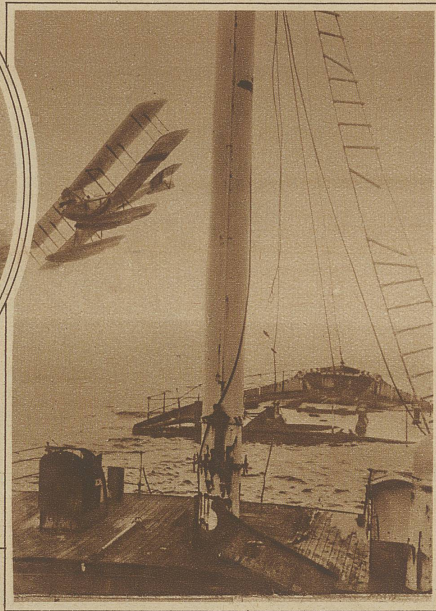
Rechts: Ein Flieger umkreist ein aufgefundenes Wrack