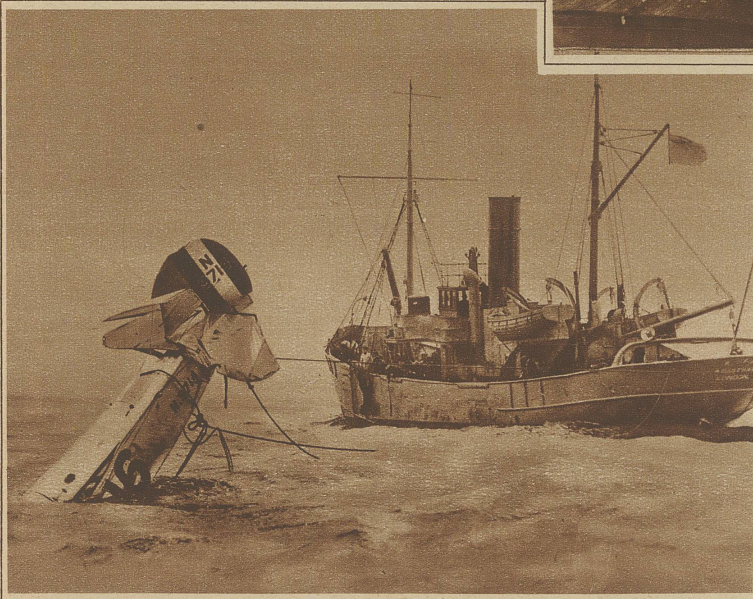
Auch ein Opfer des Sturmes im Kanal