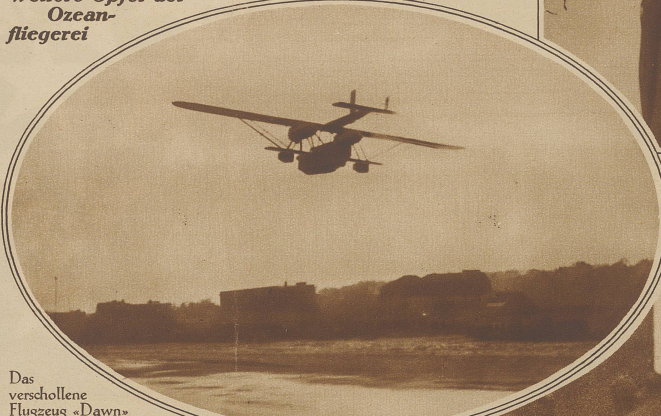
Das verschollene Flugzeug «Dawn» über Old Orchard