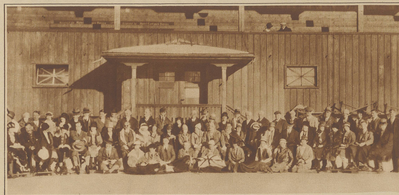
Eine Gesellschaft englischer Aerzte, die sich gegenwärtig auf einer Studienreise durch die Schweiz befindet