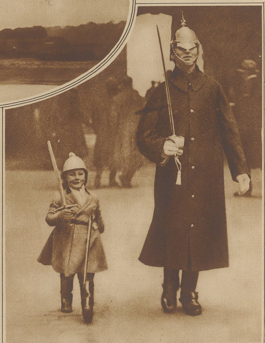
Aus der Londoner Weihnachtsparade. Ein großer und ein kleiner Leibgardist