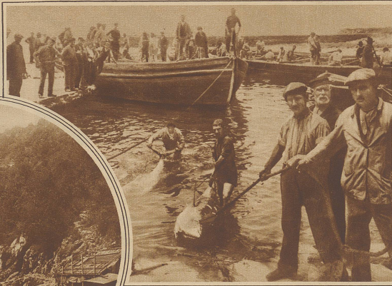
Die gefangenen Tunfische werden an Land gebracht