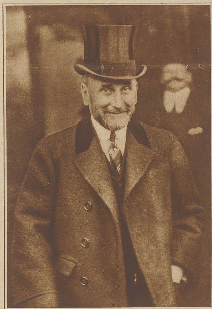
Sergej Dimitriewitsch Sasonow, ehemaliger Außenminister Russlands, ist am 27. Dezember im Alter von 61 Jahren in Nizza gestorben. Sasonow war in hervorragender Weise am Ausbruch des Weltkrieges beteiligt