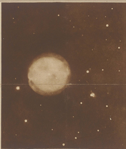
Der «Eulen-Nebel» im Sternbild des Großen Bären Beispiel eines planetarischen Nebels