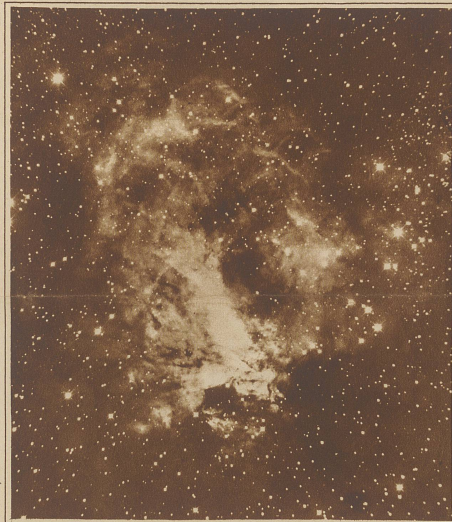
Der «Omega-Nebel» im Sternbild des Schützen Beispiel eines unregelmäßigen Gasnebels