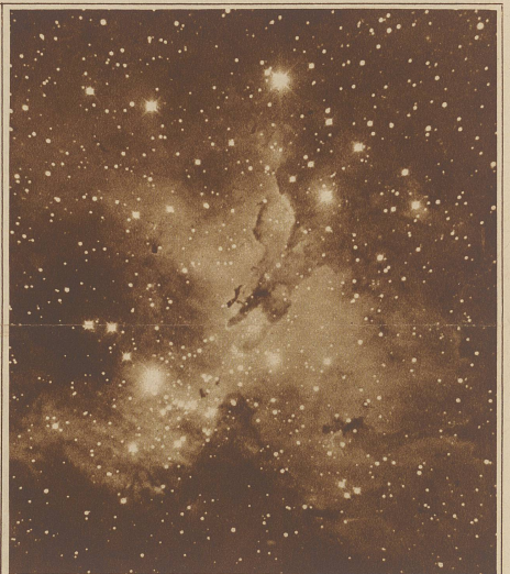
Unregelmäßige Nebelmassen im Sternbild des Perseus