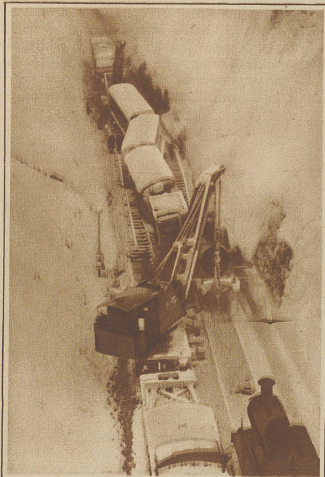
Ein Eisenbahnunglück, das unabsehbare Folgen hätte haben können, ereignete sich bei Coulsdon (England), wo im Moment, als ein Eisenbahnzug durch einen tiefen Einschnitt fuhr, ein Erdrutsch erfolgte und Lokomotive und Wagen aus den Schienen warf. Nur dem Umstande, daß der Zug mit stark verminderter Geschwindigkeit fuhr, ist es zu verdanken, daß die Passagiere mit leichten Verletzungen davonkamen