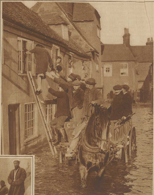
England ist neuerdings von schweren Winterstürmen und Hochwasser heimgesucht worden. Unser Bild zeigt, wie in Canterbury die Bewohner aus den obern Stockwerken gerettet werden mußten