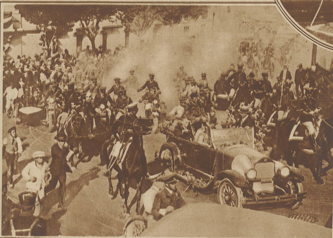
Der Empfang Lindberghs in Mexico nach seinem 5000 Kilometer-Flug in 27 Stunden