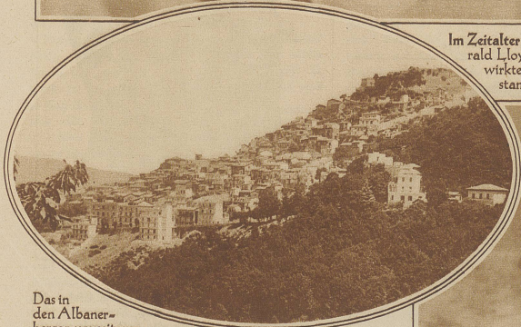
Das in den Albanbergen unweit von Rom gelegene Städtchen Rocca di Papa, das unter dem Erdbeben des zweiten Weihnachtstages am meisten gelitten hat