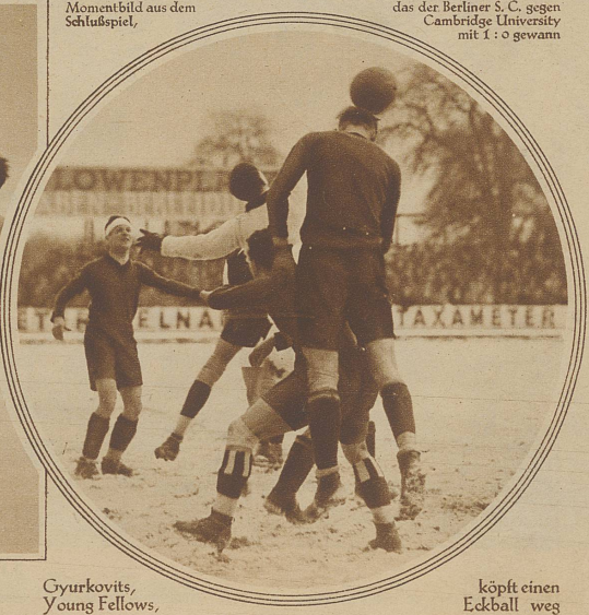
Momentbild aus dem Schlußspiel,