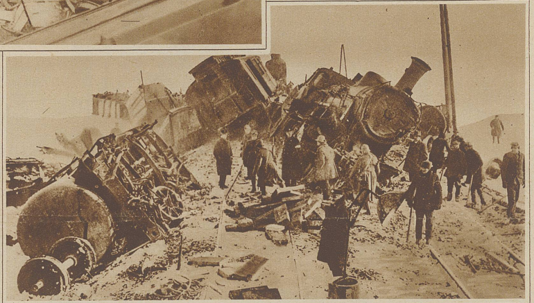
Bild rechts: Bei Lysa a. Elbe (Tschechoslowakei) fuhr ein Personenzug in einen Postzug hinein, wobei ebenfalls 4 Personen getötet und 15 schwer verletzt wurden