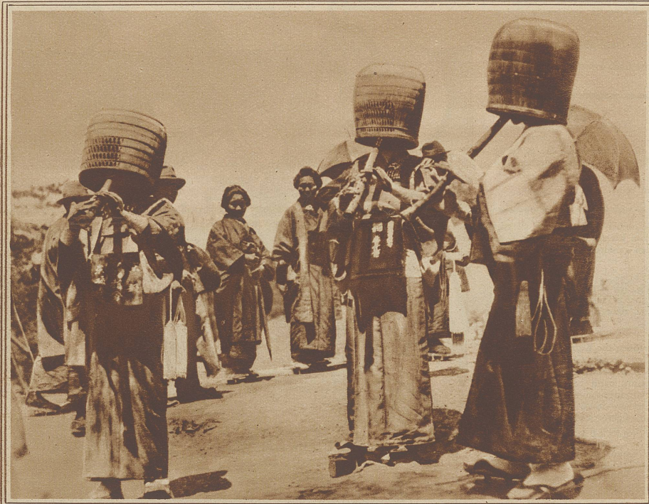
Vor den Tempeln von Nara bedecken sich die japanischen Buddhisten die Gesichter mit Körben und blasen zur Sühne der Gottheit alte Weisen auf der Flöte

Sie ist erschrocken. Sie wagt schwache Einwendungen.