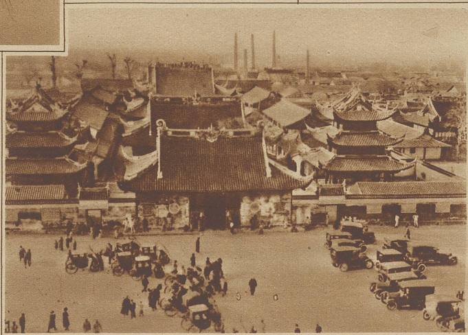
Die Konfuzepagode am sogenannten Pfirsichblüten-Sonntag, an dem jeder chinesische Autobesitzer der Sitte gemäß einen Ausflug zu ihr macht. Im Hintergrunde die Schornsteine der neuen Fabriken

Als Präsident Wilson das Schlagwort vom «Selbstbestimmungsrecht der Völker» in die Welt schleuderte, hat er wohl schwerlich geahnt, daß es sich in so kurzer Zeit gegen die Weißen kehren und deren Errungenschaften im Osten bedrohen würde. Bis zur Proklamierung dieses Gedankens haben die Chinesen, abgesehen von den rasch niedergeschlagenen Aufständen gegen die Fremden, es jahrzehntelang selbstverständlich gefunden, daß sämtliche Häfen ihres riesigen Landes in den Händen der Europäer waren und damit auch alle Rechte und Einkünfte des Handels und der Politik. Reiche, große Städte mit fast ganz europäischem Charakter blühten in ihrem Lande auf, ohne daß sie den geringsten Einfluß auf sie, den