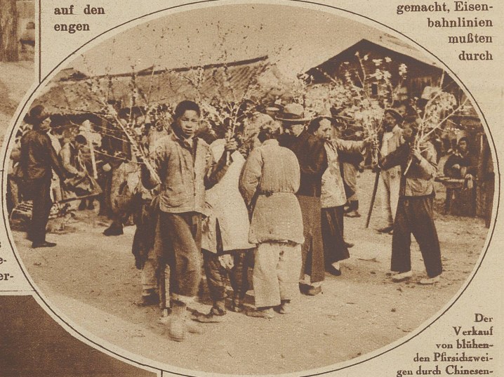
Der Verkauf von blühenden Pfirsichzweigen durch Chinesen-jungen bei der Konfuzepagode am Pfirsichblüten-Sonntag

oder weniger unberührt, der maleische Schmutz auf den engen