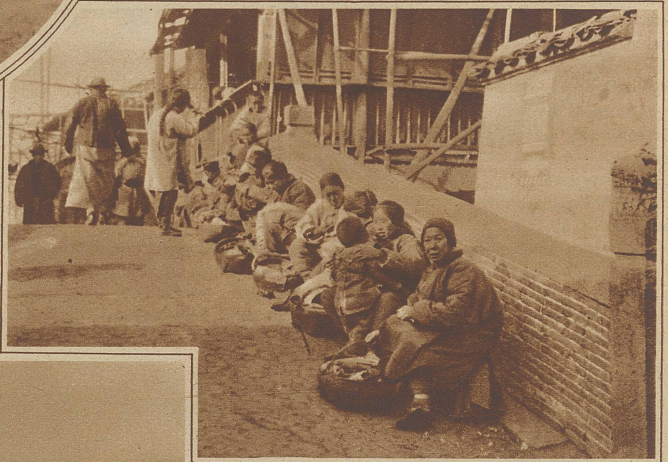
Auf der Brücke sitzen Frauen, die vorüberziehenden Rikschakulis die zerrissenen Kleider flicken

ihren Besitzern, so daß manche chinesische Straßen wie eine riesige Vogelhandlung aussehen. Am sonderbarsten für unser Gefühl sind die chinesischen Leichenbegängnisse, denn das chinesische Sittengebot schreibt den Hinterbliebenen vor, alles, was der Verstorbene besaß, welchen Wert es immer hatte, ihm entweder ins Grab mitzugeben oder am Bestattungstage während der Leichenfeier zu verbrennen. Bei den Reichen geschieht dies auch wirklich noch heutigen Tages und so köstlich die Juwelen und Schmuckgegenstände sind, die man in die Gräber legt, sie werden selten gestohlen. Graberschändung ist das entsetzlichste aller Verbrechen. Weniger Bemittelte schlagen, um dies zu sparen, einen Ausweg ein. Zwar wollen auch sie den teuren Entschlafenen nicht um sein Recht bringen, das zu Lebzeiten Benutzte und Besessene durch die Verbrennung in den allewigen Besitz in das Jenseits mitzunehmen. Aber da nach dem Einäschern der