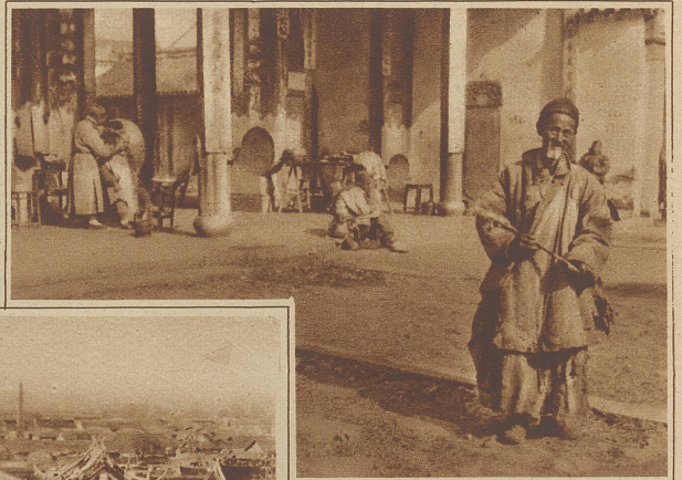
Bettler im Vorhof des Tempels. Im Hintergrund: Der Barbier rasiert den Priester

Als Präsident Wilson das Schlagwort vom «Selbstbestimmungsrecht der Völker» in die Welt schleuderte, hat er wohl schwerlich geahnt, daß es sich in so kurzer Zeit gegen die Weißen kehren und deren Errungenschaften im Osten bedrohen würde. Bis zur Proklamierung dieses Gedankens haben die Chinesen, abgesehen von den rasch niedergeschlagenen Aufständen gegen die Fremden, es jahrzehntelang selbstverständlich gefunden, daß sämtliche Häfen ihres riesigen Landes in den Händen der Europäer waren und damit auch alle Rechte und Einkünfte des Handels und der Politik. Reiche, große Städte mit fast ganz europäischem Charakter blühten in ihrem Lande auf, ohne daß sie den geringsten Einfluß auf sie, den