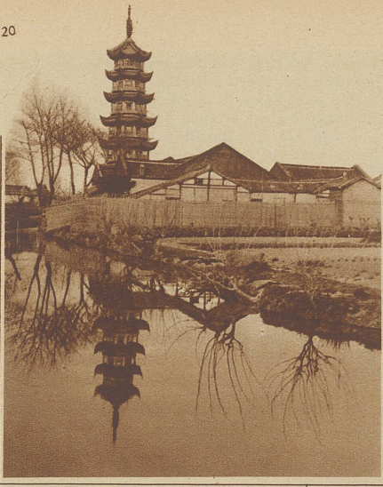
Der fünfstöckige Turm der Konfuzepagode bei Schanghai mit geschweiften Balkonen

geringsten Nutzen von ihnen gehabt hätten, und die reichste, bedeutendste darunter war stets Schanghai gewesen, das jetzt infolge der starken Bestrebungen