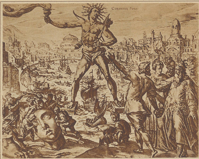
Der Koloß von Rhodos, unter dessen Beinen durch die Schiffe mit vollen Segeten ein- und ausfahren konnten