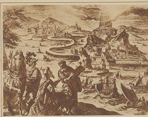
Der Leuchtturm von Alexandrien

und berechnet, um wieviel unser heimatliches Gestirn aus dem Schwerpunkt gekommen wäre, wenn man diesen Bau «bis an den Himmel» vollendet hätte. — Wohl das berühmteste Labyrinth des Altertums stand auf der Insel Möris in Aegypten. Es war um das Jahr 2200 v. Chr. ganz aus Marmor erbaut und soll in seinem gewaltigen Innern 3000 Gebäude, die sich zu 12 palastartigen Gruppen zusammenschlossen, enthalten haben. Inmitten dieser Herrlichkeit der 12 Paläste lag ein großer Irrgarten, der nur einen Eingang besaß. / Heute im Zeitalter der Technik haben