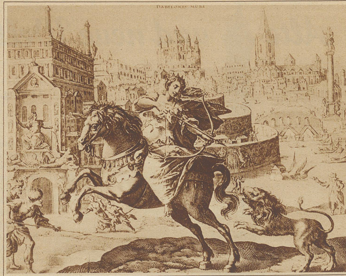
Die hängenden Gärten von Babylon, deren Schöpferin die sagenhafte Semiramis gewesen sein soll. Im Vordergrund Semiramis zu Pferd, mit dem Pfeil auf einen Löwen schießend

Helios, die 34 m hoch war. Diese Statue, richtiger gesagt, dieser Koloß war über dem Eingang zum Hafen errichtet. Chares, ein Künstler aus Lindos, hatte die Statue in Metall gegossen und nach zwölfjähriger Arbeit vollendet. Ein Erdbeben stürzte das Wunderwerk ein halbes Jahrhundert später um. Als die Araber im 7. Jahrhundert n. Chr. die Insel Rhodos eroberten, verkaufte der mohammedanische Feldherr die Koloßtrümmer an einen Händler von Edessa, der zur Wegschaffung des Erzes 900 Kamele benötigte. Ein ehemaliger Sonnengott auf Kamelen verladen — ist auch ein Witz der Weltgeschichte. Der Leuchtturm von Alexandrien war unter den wenigen Leuchttürmen des Altertums der berühmteste. Das angeblich 170 m hohe Bauwerk wurde