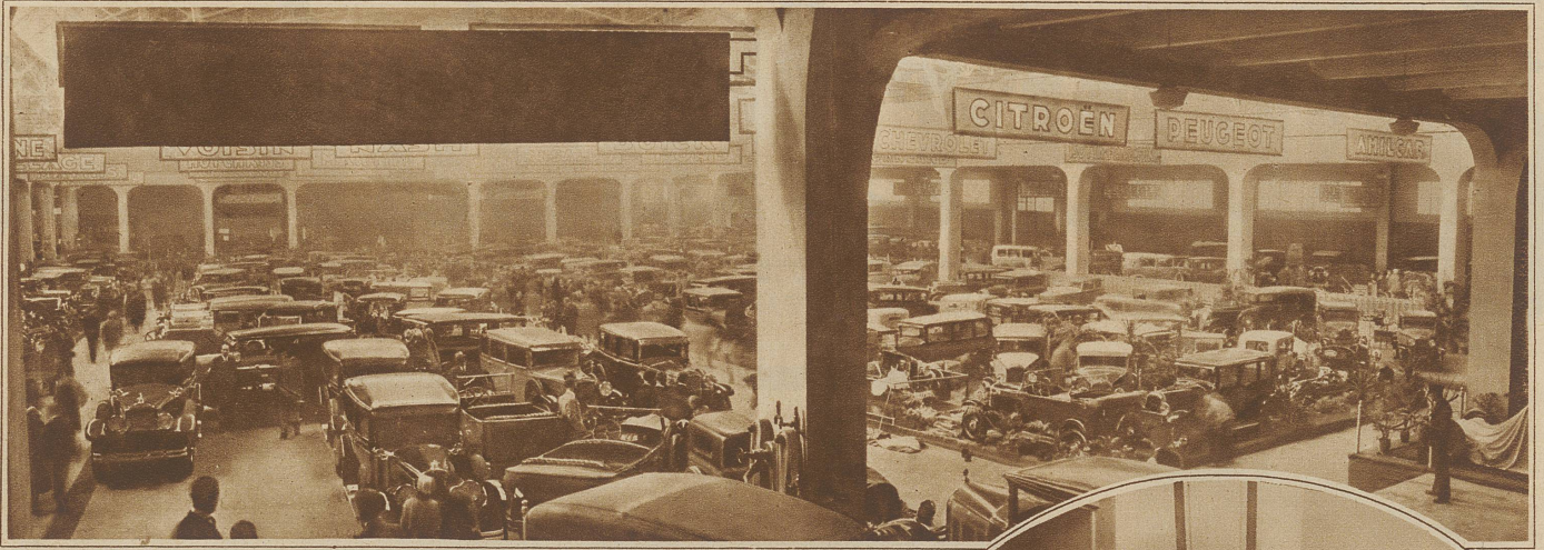
Blick in die große Ausstellungshalle