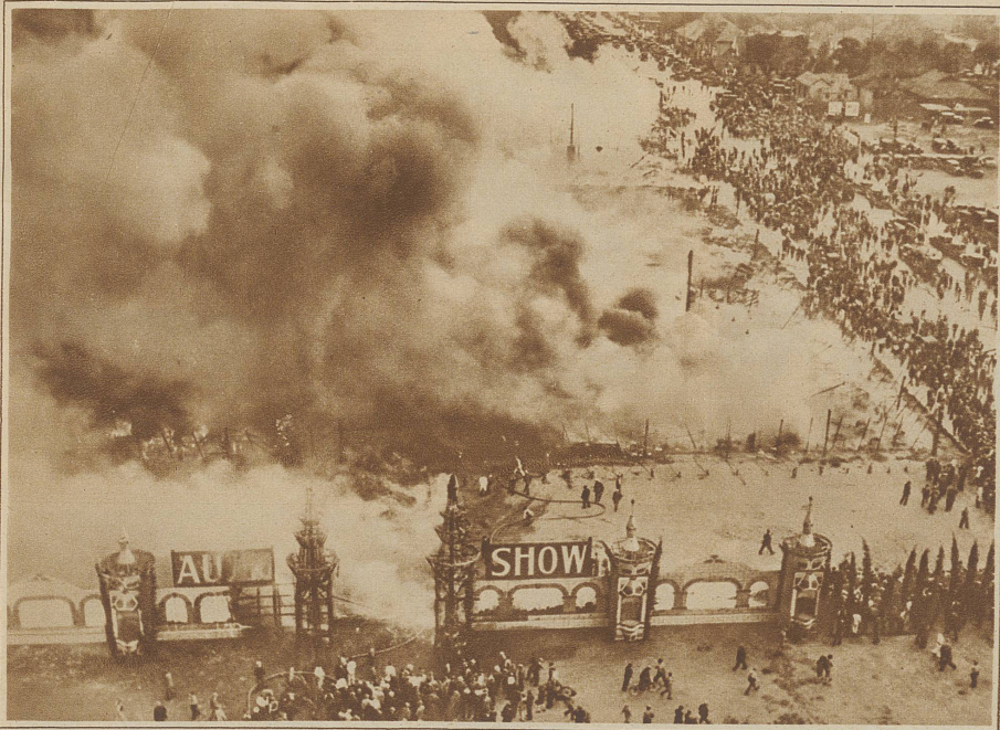
Brand einer Automobil-Ausstellung. In der nationalen Automobil-Ausstellung in Los Angeles brach eine gewaltige Feuersbrunst aus, der mehr als 300 neue, meist hochwertige Automobile und eine Anzahl Flugzeuge zum Opfer fielen. Der Schaden wird auf 10 Millionen Dollar geschätzt. Die 2500 Besucher, die sich im Moment des Brandausbruches in der Ausstellung befanden, stürmten in wilder Panik ins Freie. Verursacht wurde die Feuersbrunst durch einen Flugzeugmotor, der während einer Demonstration in der Halle in Brand geriet