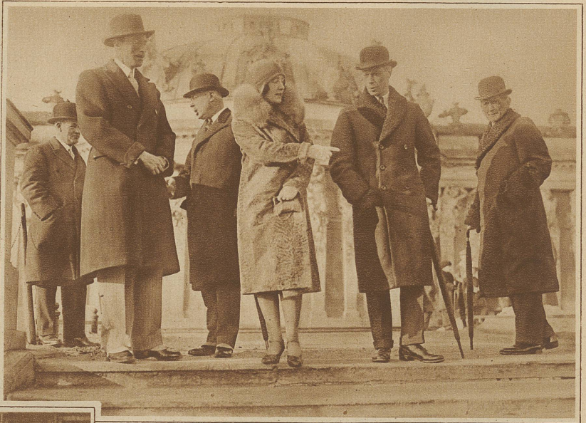
Der Herzog von York in Berlin. Der zweite Sohn des Königs von England hat mit seiner Gemahlin auf der Durchreise nach Oslo, wo er bei der Hochzeit des Kronprinzen Olaf als Trauzeuge fungiert, seit dem Kriege als erstes Mitglied der englischen Königsfamilie Deutschland einen Besuch abgestattet. Das Bild zeigt das Herzogspaar vor dem Schloß Sans Souci in Potsdam bei Berlin