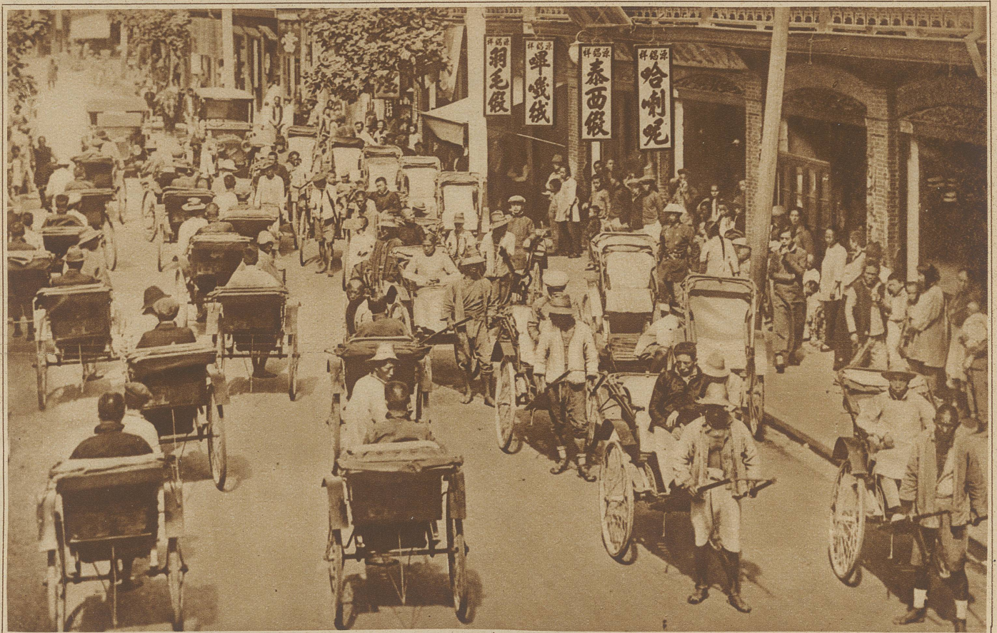
Riksha-Kulis. Trotz der energischen Vorstellungen, die von europäischer Seite zur Abschaffung der Rikshas unternommen wurden, bildet dieses Gefährt auch heute noch das Hauptverkehrsmittel der chinesischen Städte. Stundenlang traben die Kulis mit den Zweiräderkarren Gass' auf Gass' ab, bis der «Herr» gütigst auszusteigen geruht und ihnen während seines Aufenthaltes im Teehaus oder Bazar einige Minuten der verdienten Ruhe gönnt. Wie lange mag es noch dauern, bis das Automobil als modernes Verkehrsmittel dieses, die Menschheit entwürdigende Bild, aus den Gassen verdrängt