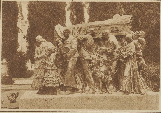
Wie Spanien seine Stierkämpfer ehrt. Dem berühmten spanischen Toreador Joselito El Gayo, der bei einem Stierkampf den Tod fand, ist in Sevilla dieses prächtige Denkmal errichtet worden