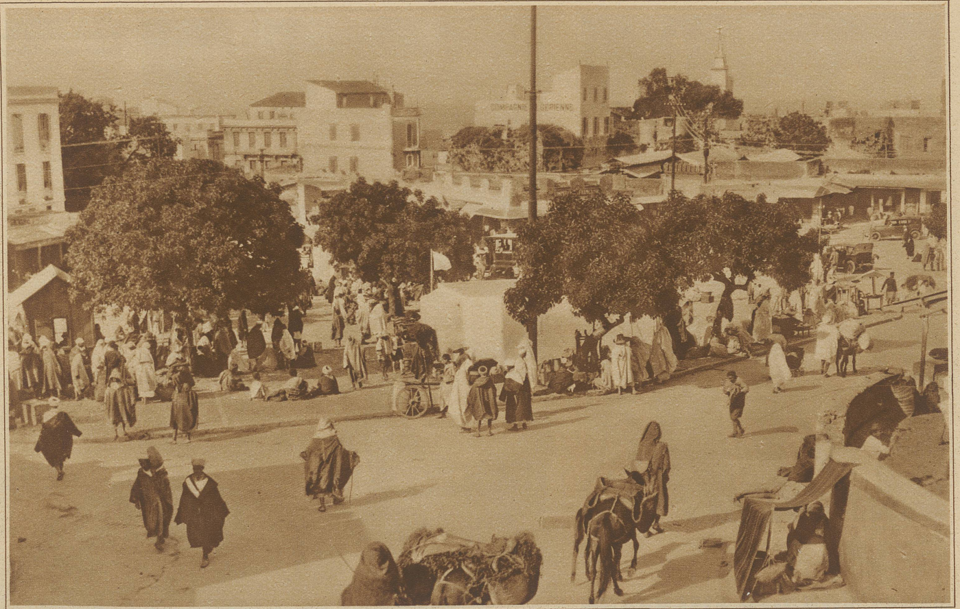
Straßenbild aus Tanger, der internationalen Stadt in Marokko. Den ganzen Tag, ausgenommen die heißesten Mittagsstunden, hocken und stehen die Eingeborenen auf den Straßen herum und warten, daß es Abend werde. Am andern Morgen beginnt das «Tagewerk» aufs neue