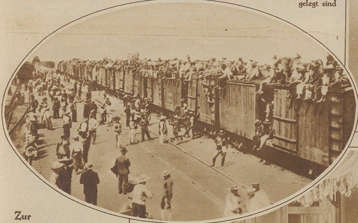
Zur Revolution in Mexiko. Wie die Regierungstruppen auf den Kampfplatz geführt werden