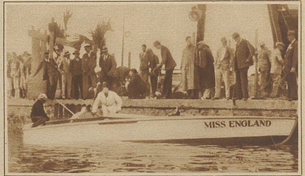
Mayor Segrave, dem es vorige Woche gelang, einen neuen Geschwindigkeitsrekord für Automobile aufzustellen, will nun auch den Motorbootrekord brechen. Schon die ersten Versuchsfahrten mit der «Miss England» gelangen vorzüglich, so daß man hofft, auf der Rennstrecke in Miami sensationelle Geschwindigkeiten erreichen zu können