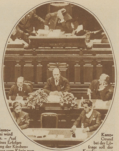
Mussolini wird Kanzler. - Auf Grund seines Erfolges bei der Lösung der Kirchenfrage soll der Duce vom König zum Kanzler ernannt werden. Damit würde auch seine vielseitige Ministerstätigkeit gekrönt, die heute schon 8 Ressorts umfaßt, nämlich: Ministerpräsidium, Außen-, Kriegs-, Marine-, Luftfahrt-, Gewerkschafts-, Innen- und Kolonialministerium. Das Bild zeigt den Diktator bei seiner letzten Ressortrede im Parlament