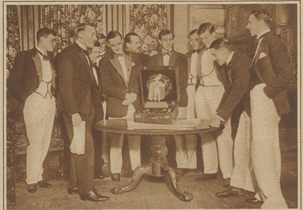
Die Oxforder Universitäts-Rudermannschaft kreiert eine neue Herrenmode. Bei gesellschaftlichen Anlässen tragen die Studenten weiße Flanellhosen, eine weiße, mit schwarzen Seidenborden eingefasste Weste und dazu den üblichen Smokingrock