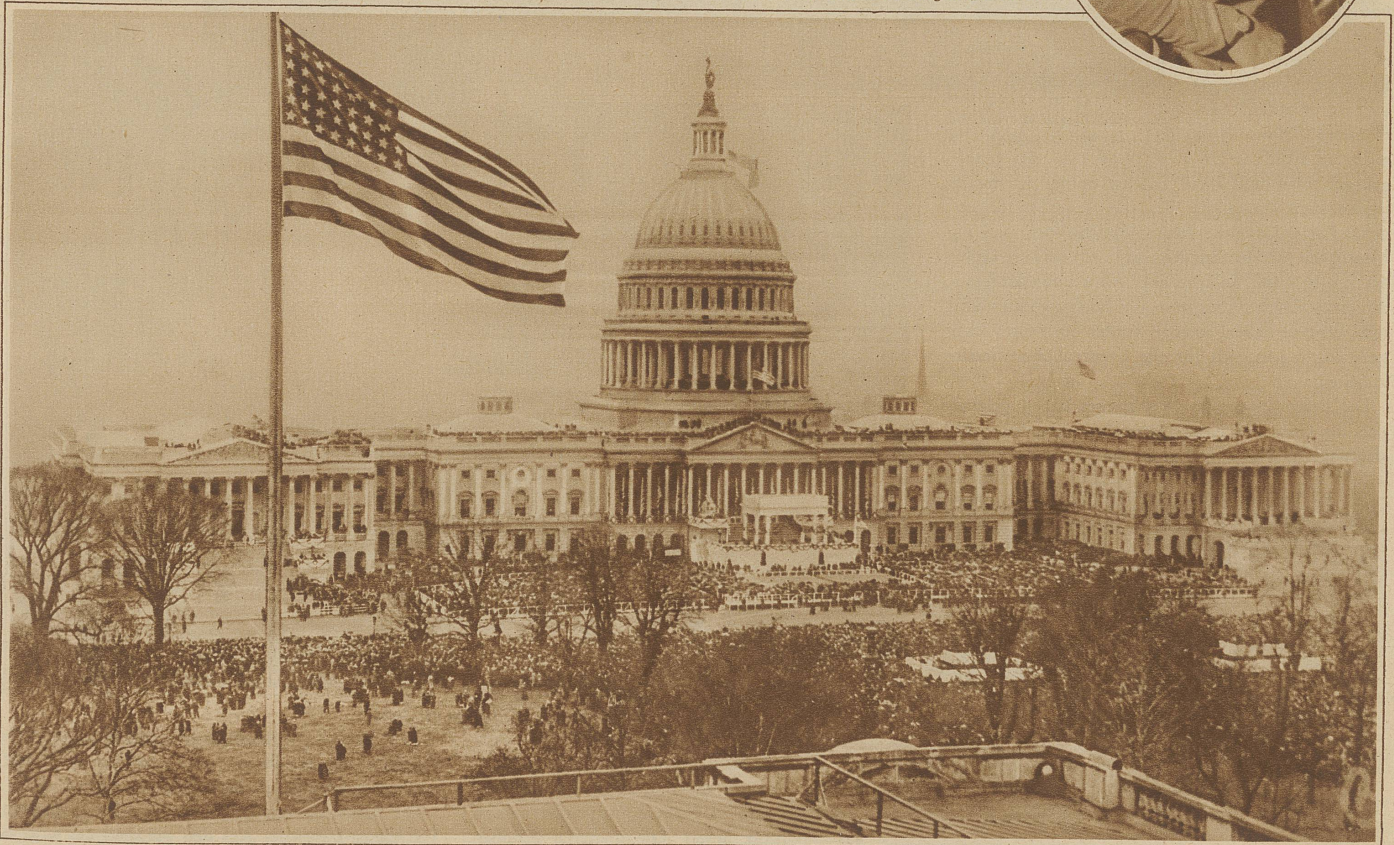
Präsident Herbert Hoovers Amtsantritt in Washington. Blick auf das festlich geschmückte Capitol während der Feier der Amtsübergabe