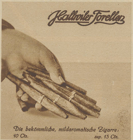
Die bekömmliche, mildaromatische Zigarre. 10 Cts. sup. 15 Cts.

Direkt am Strand / Fließ. Wasser, w. u. k. in allen Zimmern / Apparate mit Bad / Pension von Fr. 9.- aufw. / Man spricht deutsch.