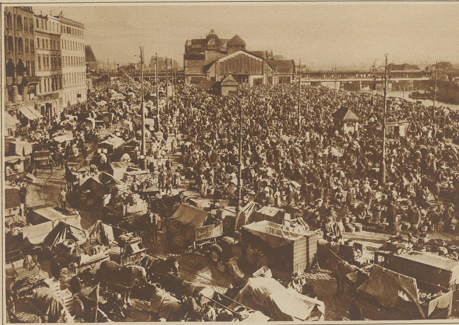
Hamburger Gemüsemarkt, der größte der Welt