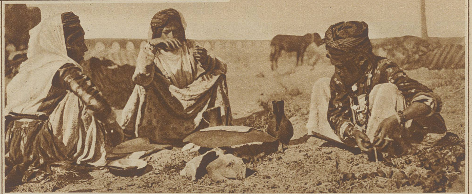
Frauen nomadisierender Kurden bei der Mahlzeit

es nicht. Durch Tskerkesinnen, Balkansklavinnen und Europäerinnen ist manches blond und blau bei weißer Haut hereingekommen, durch Neger und Negerin aber in weit höherem Maße tiefdunkle Farben. Wie bei allen Bastardvölkern herrscht zudem Fettlieblichkeit vor, ja, die fette Frau ist Wunschbild aller Orientalinnen geworden. Damit im Zusammenhang steht das schnelle Reifen sowie das furchtbar frühe Altern