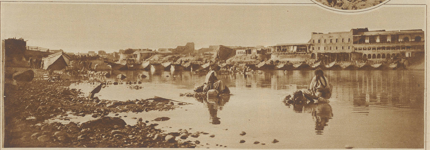
Große Wäsche auf dem Tigris