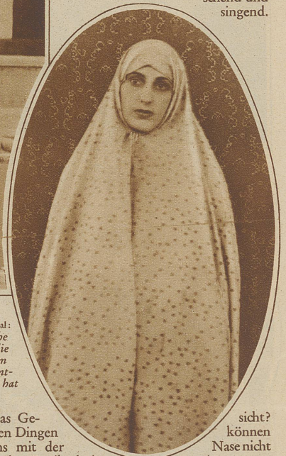
Bild im Oval: Persische Frau, die sich zum Gebet entschleierte hat

Und das Ge- Vor allen Dingen wir uns mit der befreunden. Es gibt drei Nasen im Morgenlande, die europäische, die alarodische und die negerische. Die beiden letztern, die eine fleischig und oft gebogen, die andere breit und flach, herrschen weitaus vor. Die andere, gerade und fein, ist ziemlich selten. Die Augen sind fast immer samtenes Braun und häufig mandelförmig geschnitten, die Brauen darüber werden gern durch schwarze Schminke über der Nasenwurzel verbunden. Vielfach wird indigoblau Tätowierung auf Wangen,