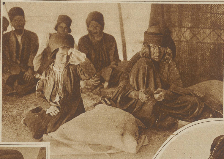
Kurdische Zigeuner in ihrem Zelt