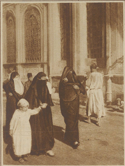
Straßenbild aus Kairo